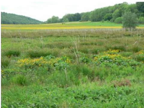
Schopflocher Moor nördlich von Lenningen-Schopfloch

Das Schopflocher Moor auf der Albhochfläche ca. 2400 m nördlich von Lenningen-Schopfloch bildete sich in einer flachen Senke über einem Maar des Schwäbischen Vulkans, dessen Basalttuffe das Wasser stauten. Aus einem ursprünglichen flachen See entstand durch Verlandung zuerst ein nährstoffreiches Niedermoor, auf dem sich dann auf Grund der hohen Niederschläge (um 1060 mm/Jahr) ein mehrere Meter mächtiger Hochmoorschild emporwölbte. Dieses über das Grundwasser herausgewachsene Hochmoor – im Gegensatz zum Niedermoor sehr nährstoffarm und sauer – weist eine typische Pflanzenausstattung mit säurezeigenden Pflanzenarten auf (Heidelbeere, Torfmoose, Moosbeere u. a.), die für die ansonsten von Kalkzeigern geprägte Schwäbische Alb etwas Besonderes darstellt. Seit dem 18. Jahrhundert wurde intensiv abgetorft, so dass heute nur noch Reste vorhanden sind. Um das Moor zu retten, wurde es vom