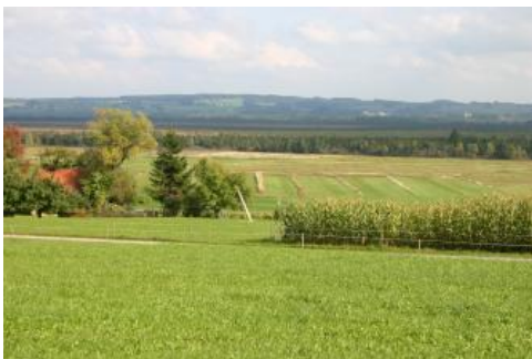
Blick über das Wurzacher Ried

Der etwa 1700 Hektar große Moorkomplex des Wurzacher Rieds liegt im Nordosten des Landkreises Ravensburg. Hier formte der Rheingletscher während der Riß-Eiszeit ein großes Zungenbecken. Vor allem während seines zweiten Vorstoßes tiefte sich der Gletscher zwischen der Grabener Höhe im Nordwesten und dem Ziegelbacher Berg im Südosten stark ein. Der Endmoränenwall von Dietmanns bildet die nördliche Begrenzung des Wurzacher Rieds. In der letzten Eiszeit riegelte der Rheingletscher bei seinem Hauptvorstoß das Becken im Südwesten mit dem Wall der Äußeren Jungendmoräne ab, sodass sich ein Eisrandstausee bildete. In diesen See wurden große Mengen an Schmelzwasserschotter und feinkörnigen Beckensedimenten abgelagert. Nach dem Ende der Eiszeit verlandete der See vollständig,