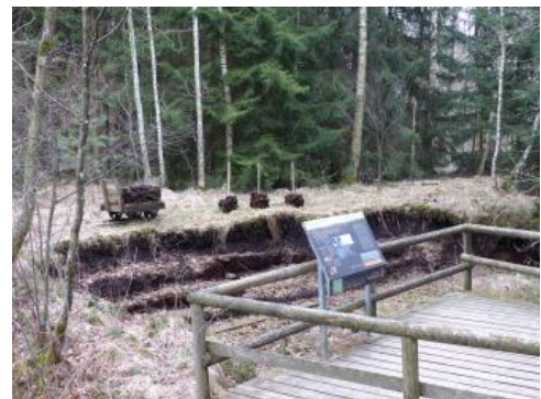
Wasserlehrpfad „auf den Spuren der Torfstecher“ bei Bad Wurzach

Wie in allen größeren Mooren wurde auch im Wurzacher Ried versucht, durch Entwässerung landwirtschaftliche Nutzflächen und durch Torfstiche Brennmaterial zu gewinnen. Während des 18. Jahrhunderts wurden deshalb erste Entwässerungsgräben angelegt. Die planmäßig angelegten, großen Torfstiche wurden seit der Gründung des Waldburg-Wurzachschen Torfwerks von 1880 bis ins Jahr 1962 betrieben. Seit dem Ende des Badetorfabbau 1995 versucht man die vom Menschen beeinträchtigten Moorflächen durch Wiedervernässung zu regenerieren. Im Oberschwäbischen Torfmuseum im ehemaligen Torfwerk gibt es in der Ausstellung oder bei einer Fahrt mit der Torfbahn viel Wissenswertes über das Wurzacher Ried und den früheren Torfabbau zu entdecken.