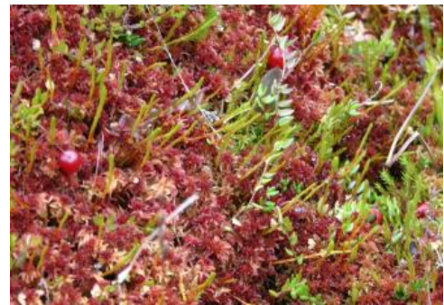
Torfmoos und Moosbeeren im Wurzacher Ried

Das über 1800 ha umfassende Naturschutzgebiet Wurzacher Ried bildet den Lebensraum für annähernd 800 Pflanzenarten. Aufgrund seines kühl-feuchten Kleinklimas mit durchschnittlich 120 Frosttagen im Jahr dient es als wichtiger Rückzugsraum für aus dem nordischen und arktischen Raum stammende Tiere und Pflanzen. Darüber hinaus ist es als Rastplatz für Zugvögel von Bedeutung. Seit 1989 ist das Wurzacher Ried als einziges Naturschutzgebiet in Baden-Württemberg vom Europarat mit dem Europadiplom der Kategorie A ausgezeichnet. Das Naturschutzzentrum in Bad Wurzach bietet zahlreiche Informationen und Veranstaltungen rund um das Wurzacher Ried.