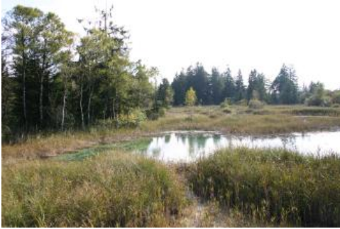
Die Haidgauer Quellseen im Südteil des Wurzacher Rieds

Das Wurzacher Ried wird heute vom Hochmoorschild des Haidgauer Rieds beherrscht, der größten noch intakten Hochmoorfläche Mitteleuropas. Mit seiner typischen, uhrglasförmigen Aufwölbung erhebt sich das Haidgauer Ried deutlich über den Grundwasserspiegel. Unter den extremen Verhältnissen eines Regenwassermoors gedeihen Torfmoose ( Sphagnum ) und Wollgras ( Eriophorum ) noch am besten und bilden so die Hauptbestandteile des Hochmoortorfs. So sind in den letzten Jahrtausenden bis zu 7,5 m mächtige Hochmoortorfe aufgewachsen. Zusammen mit darunter liegenden Niedermoortorfen und organischen Seeablagerungen (Mudden) ergibt sich eine maximale Mächtigkeit des Moorkörpers von 9,5 Metern. Weitere kleinere Hochmoor-Aufwölbungen sind durch Niedermoore entlang von Wurzacher und Dietmannser Ach und dem Rand des Wurzacher Rieds