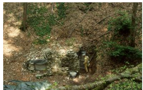
Künstlicher Eingang in das Höhlensystem hinter dem Aachtopf in einem Erdfall ca. 500 m nördlich der Aachquelle

Etwa 500 m nördlich der Aachquelle befinden sich mehrere große Erdsenkungen. Zwei ca. 20 m tiefe Dolinen mit Durchmessern über 40 m sind in die Schichten der Rauhen Kalke innerhalb der Zementmergel-Formation (früher Weißjura zeta 2) eingetieft; die Kalksteine sind an den Dolinenwänden gut zu erkennen. Ihre Entstehung steht vermutlich in Zusammenhang mit der Verkarstung und Kalklösung durch die Karstwässer, die am Aachtopf austreten. Einer Gruppe von Höhlenforschern gelang es vor einigen Jahren, sich – ausgehend von einer der beiden Dolinen – mit einem 105 m tiefen Schacht zu den unterirdischen Karstgewässern vorzuarbeiten.