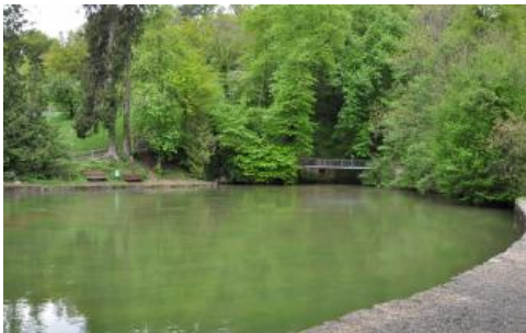
Der Aachtopf bei Aach ist die am stärksten schüttende Karstquelle Deutschlands

Das im Aachtopf austretende Wasser stammt zum größten Teil aus den Versickerungsstellen der Donau am Wehr und im Brühl bei Immendingen sowie bei Fridingen an der Donau. Der Aachtopf ist die am stärksten schüttende Karstquelle Deutschlands mit einer mittleren Schüttung von rd. 8000 l/s (min. 1310 l/s, max. 24 100 l/s) und einem ca. 280 km 2 großen Einzugsgebiet. Auf seinem unterirdischen Weg löst das Wasser jährlich einige 1000 m 3 Kalkstein. Nördlich des Quelltopfs stehen unten gebankte Kalksteine der Liegende-Bankkalke-Formation (früher Weißjura zeta 1) und darüber massige Kalksteine des Oberen Massenkalks an. Taucher gelangten vom Ausfluss der Quelle zunächst 17 m in die Tiefe, dann schräg nach Norden in eine Wasserhöhle von 1–3 m Breite, 3–6 m Höhe und über 500 m Länge.