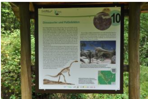
Informationstafel am Geologischen Lehrpfad im Kirnbachtal

Nach einem weiteren kurzen Anstieg erhält man einen Einblick in die rötlichen Gesteine der Trossingen-Formation (Knollenmergel), die durch ihre Neigung zu Rutschungen eine typische bucklige Hangoberfläche bilden. Der mancherorts zu erkennende säbelförmige Wuchs der Bäume deutet ebenfalls darauf hin, dass der Hang in Bewegung ist. Bekannt wurde der württembergische Knollenmergel auch durch mehrere Funde von Plateosauriern. Eingelagerte weiße oder rötliche Kalkkonkretionen („Knollen“) gaben dem Knollenmergel seinen Namen. Der Anstieg führt weiter durch den Olgahain, einen ehemaligen Park der württembergischen Königin Olga, der noch an alten Sandstein-Treppen, kleinen Weihern und mächtigen alten Buchen zu erkennen ist und zu dem man ebenfalls eine Informationstafel sowie einen Gedenkstein vorfindet.