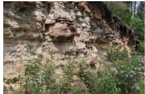
Aufschluss in der Löwenstein-Formation (Stubensandstein)

Beim Anstieg aus dem Kirnbachtal stehen als nächstes Sandsteine der Löwenstein-Formation (Stubensandstein) am Weg an und sanden weiß ab. Der Name Stubensandstein ist auf die frühere Verwendung als Scheuersand beim Reinigen der Wohnstuben zurückzuführen. Ein Krustenkalk, ein unter festländischen Bedingungen in trocken-heißem Klima entstandenes Karbonatgestein aus verfestigten Kalkbruchstücken, folgt ein Stück hangaufwärts. Die Entstehung der Schichtstufenlandschaft im Tübinger Raum ist das Thema der nächsten Tafel.