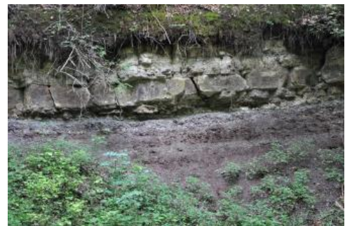
Steigerwald-Formation (Untere Bunte Mergel) und darüber liegende Bank der Hassberge-Formation (Kieselsandstein)

Ausgangspunkt ist der zwischen Bebenhausen und Tübingen unmittelbar an der L1208 gelegene Wanderparkplatz „Kirnbachtal“. Auf der mit Dinosauriern markierten, ca. 5 km langen Strecke wird an 13 Stationen die Landschaftsgeschichte erklärt und Einblick in die Gesteinsabfolgen des oberen Mittelkeupers und des Oberkeupers (Exter-Formation, „Rhät“) gegeben, die entlang des Kirnbachs und beim Anstieg zum Olgahain in mehreren Aufschlüssen studiert werden können.