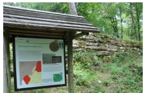
Informationstafel im ehemaligen Sandsteinbruch (Oberkeuper) auf dem Kirnberg

Am Plateaurand sind schließlich die harten Sandsteine des Oberkeupers (Exter-Formation, „Rhätsandstein“) aufgeschlossen, die auch als dünne Schuttdecke den oberen Bereich der Knollenmergel-Hänge überlagern. In einem alten Steinbruch, bei dem sich auch eine Grillhütte befindet, können die gut geschichteten, feinkörnigen Quarz-Sandsteine, die früher als fast unverwüchtlicher Bau- und Pflasterstein abgebaut wurden, bestens studiert werden.