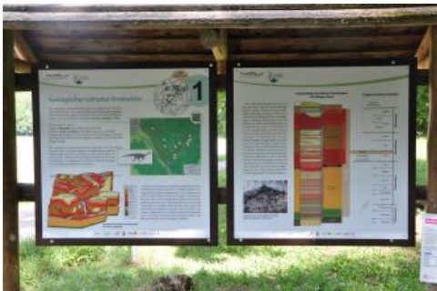
Informationstafel am Geologischen Lehrpfad im Kirnbachtal bei Tübingen

Der Lehrpfad wurde bereits 1977 anlässlich der 500-Jahrfeier der Eberhard-Karls-Universität Tübingen vom Institut und Museum für Geologie und Paläontologie, der Naturparkverwaltung Schönbuch und den Forstbehörden angelegt. Er gehört damit zu den Ersten seiner Art im Land (Baier, 2011; Eberle & Lehr, 2015). Nachdem der Lehrpfad stark in die Jahre gekommen war, viele Tafeln zerstört und Aufschlüsse zugewachsen waren, wurde 40 Jahre später, am 2. Juni 2017 eine inhaltlich und gestalterisch erneuerte Anlage wiedereröffnet.