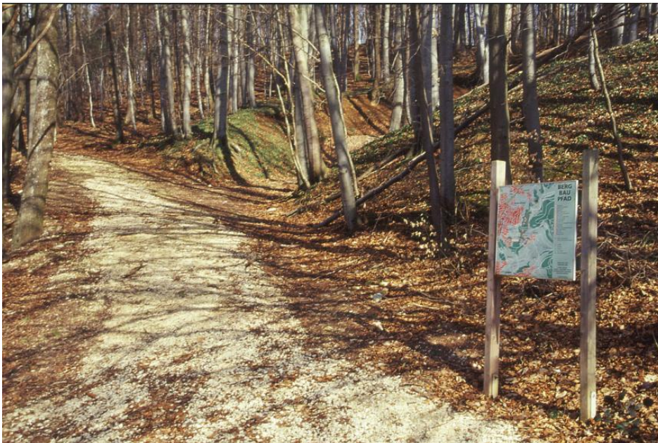
Bergbaupfad bei Aalen-Wasseralfingen

Erzabbau und Eisenverhüttung haben im Raum Aalen eine Jahrhunderte lange Tradition. Um diese lebendig zu halten nachdem die Hochöfen erkalten sind und der Bergbau erloschen ist, wurde dieser Bergbaupfad geschaffen. Er beginnt beim Besucherbergwerk Tiefer Stollen. Auf dem abwechslungsreichen Rundweg wird an insgesamt 23 Info-Stationen auf ansprechenden Übersichts-, Lehr- und Objekttafeln die Geschichte des damaligen Bergbaus erläutert. Abgebaut wurden früher die eisenhaltigen Flöze in der Eisensandstein-Formation (Mitteljura).