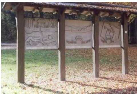
Heimatgeschichtlicher Rundweg Veringenstadt

Der Heimatgeschichtliche Rundweg auf der Schwäbischen Alb bei Veringenstadt gibt Aufschluss über die Geologie und Siedlungsgeschichte dieses Raums. Er gliedert sich in drei Stationen, die jeweils ein besonderes Thema behandeln: zuerst den Bohnerzabbau, die Entstehung der Bohnerze, ihre Gewinnung und die Verhüttung im Laucherttal; die folgende Station behandelt die geologische Entwicklung des Oberjuras; die letzte befasst sich mit der Besiedlungsgeschichte der Landschaft.