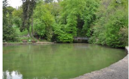
Der Aachtopf bei Aach ist die am stärksten schüttende Karstquelle Deutschlands