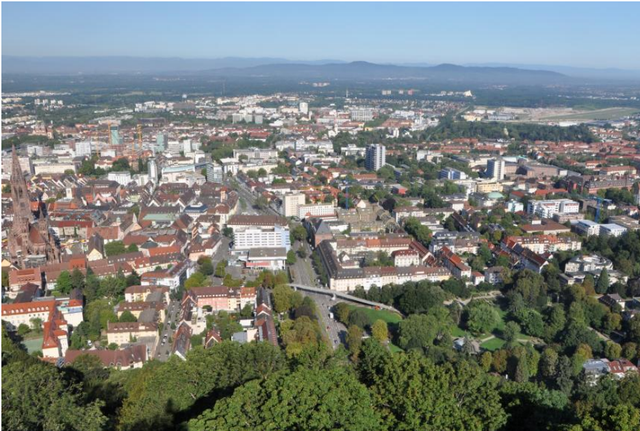
Blick vom Schlossbergturm bei Freiburg über den Oberrheingraben mit dem Kaiserstuhl bis zu den Vogesen