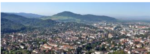
Blick vom Schlossbergturm bei Freiburg nach Südwesten zum Schönberg

Einige Bruchschollen aus Gesteinen des Erdmittelalters und Tertiärs haben das Einsinken des Oberrheingrabens nicht in vollem Umfang mitgemacht oder wurden wieder angehoben. Sie bilden heute die vor dem Schwarzwald gelegene Vorbergzone. Südlich der Stadt sieht man den Schönberg und den Lorettoberg und im Südwesten den Tuniberg. Im Norden ist die Emmendinger Vorbergzone zu erkennen. Kleinere Erhebungen, die man vom Turm aus erkennen kann sind z. B. das Lehener Bergle oder der Nimberg. Besonders die markante Schönbergscholle ist durch die Grabenbildung stark zerbrochen und