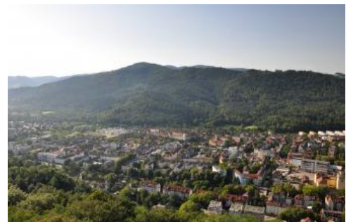
Blick vom Schlossbergturm ins Dreisamtal bei Freiburg

Nach Süden geht der Blick ins Dreisamtal, das sich parallel mit der Entstehung des Rheingrabens in den Schwarzwald eingeschnitten hat. Dahinter ist der Freiburger Hausberg, der Schauinsland zu erkennen, der früher den Namen Erzkasten trug, was auf den ehemaligen Bergbau dort hinweist. Den silberhaltigen Blei-Zink-Erzgängen verdankt die Stadt ihren Aufstieg und Reichtum im Mittelalter. Weiter im Hintergrund sind im Südosten der Feldberg und am Schwarzwaldrand im Südwesten der Blauen zu erkennen.