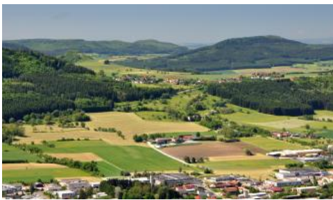
Die Baaral-Berge südwestlich von Spaichingen

Der Dreifaltigkeitsberg bei Spaichingen bildet einen markanten Vorsprung am Trauf der westlichen Schwäbischen Alb. Der Berg war schon in vorgeschichtlicher Zeit besiedelt und trägt heute eine Wallfahrtskirche. Vom Gipfel hat man einen weitreichenden Ausblick auf das Albvorland, den Albtrauf, die Baar und den Schwarzwald. Bei guter Sicht erkennt man im Süden die Vulkangipfel des Hegaus und die Alpen. Im oberen Bereich finden sich gute Aufschlüsse in den Oberjura-Kalksteinen der Wohlgeschichtete Kalke-Formation (früher Weißjura beta). An den mauerartigen hellen Felswänden ist der Dreifaltigkeitsberg schon von der Ferne zu erkennen. Mittel- und Unterhänge sowie das unmittelbar vorgelagerte Hügelland werden von