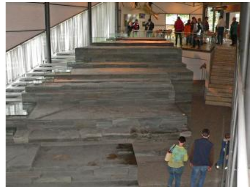
Die große Halle im Umwelt-Museum Hauff in Holzmaden