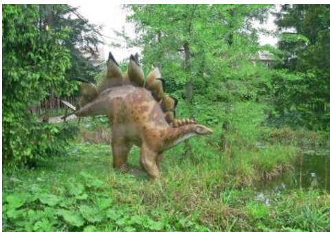
Nachbildung eines Sauriers vor dem Umwelt-Museum Hauff in Holzmaden

In der Außenanlage des Museums sind an einem Teich zwischen Schachtelhalmen, Ginkgo- und Mammutbäumen lebensgroße Modelle von Dinosauriern des Erdmittelalters zu sehen.