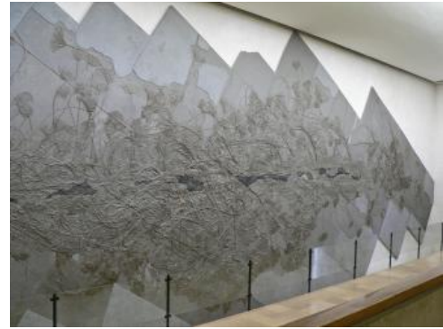
Die große Seelilienkolonie aus der Posidonienschiefer-Formation im Umwelt-Museum Hauff in Holzmaden

Mit einem naturgetreuen Nachbau der Schichtfolge der Posidonienschiefer-Formation in der großen Museumshalle wird die Entstehungsgeschichte der einzelnen Schichten mit den jeweils typischen Fossilien gezeigt. Dreidimensionale Schaubilder und Modelle von Sauriern geben Aufschluss über das Leben im Jurameer. Weitere Themen sind die Umwandlung der abgestorbenen Tiere zu Fossilien, die Suche nach ihnen im Schieferbruch und die sehr zeitaufwendige Präparation in der Werkstatt des Museums. Darüber hinaus wird die Geologie des Schwäbischen Juras erklärt und mit einer interaktiven geologischen Uhr die über 4,5 Milliarden Jahre dauernde Erdgeschichte anschaulich gemacht.