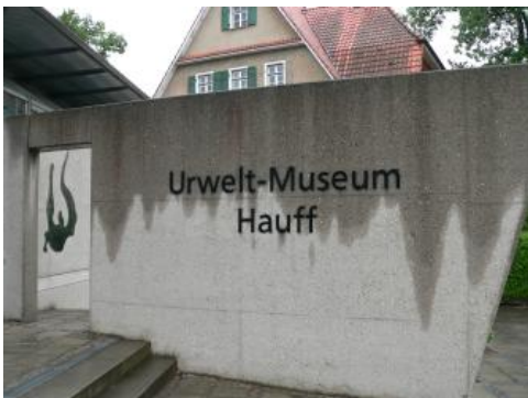
Vor dem Eingang des Urwelt-Museums Hauff in Holzmaden

Die Gegend um Holzmaden südöstlich von Kirchheim unter Teck am Fuß der Mittleren Schwäbischen Alb ist weltbekannt als Fundgebiet für Fossilien aus der Posidonienschiefer-Formation des Unterjuras (früher Schwarzjura epsilon). Die Gesteine entstanden aus tonigen und kalkigen Ablagerungen am Grund des Jurameers vor etwa 180 Mio. Jahren. Im Urwelt-Museum Hauff sind auf 1000 m 2 Ausstellungsfläche hunderte Exponate aus diesen Schichten zu besichtigen. Es ist das größte private Naturkundemuseum Deutschlands. Das Museum entstand 1936/37 aus der bereits Ende des 19. Jahrhunderts angelegten Sammlung von Bernhard Hauff (1866–1950). In Bodman-Ludwigshafen am Bodensee wurde 2021 als zweiter Standort das Urweltmuseum Bodman eröffnet.