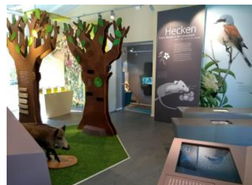
Ausstellung im Naturschutzzentrum in Beuron

Im Naturschutzzentrum wurde eine Dauerausstellung eingerichtet, die die sehr unterschiedlichen Landschaftsbereiche des Naturparks Obere Donau darstellt und erklärt. In wechselnden Sonderausstellungen werden einzelne Naturschutzthemen vertieft. Vorträge, Seminare, Tagungen und Exkursionen sind weitere Bestandteile einer umfassenden Öffentlichkeitsarbeit.