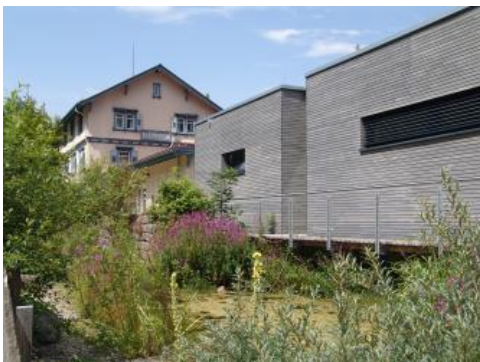
Das Naturschutzzentrum in Beuron; Foto: Naturschutzzentrum Obere Donau

Das Obere Donautal ist ein bis zu 200 m tief eingeschnittenes Durchbruchstal im Südwesten der Schwäbischen Alb und wird von zahlreichen Felsen aus hellem Oberjura-Kalkstein gesäumt. Die beeindruckende Landschaft lockt jedes Jahr Tausende Touristen an. Damit die vielen Besucher nicht zu einer Belastung für den Naturraum werden, wurde 1996 in Trägerschaft des Landes Baden-Württemberg, des Landkreises Sigmaringen und des Zollernalbkreises sowie der Gemeinde Beuron das Naturschutzzentrum Obere Donau geschaffen. Es ist im alten Bahnhof von Beuron untergebracht – ebenso wie die Geschäftsstelle der Naturparkverwaltung des Naturparks Obere Donau. Eine der wichtigsten Aufgaben des Naturschutzzentrums ist es, Besucher über die Landschaft, ihre ökologischen Zusammenhänge und Gefährdungen aufzuklären und sie für einen schonenden Umgang mit der Natur zu sensibilisieren. Die Betreuung von elf Naturschutzgebieten