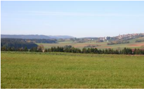
Blick entlang der Wutachschlucht bei Göschweiler nach Westen zum Feldberg

Die Wutachschlucht liegt mitten in der tektonischen Senke der Freiburg-Bonndorf-Bodensee-Störungszone. Die Schlucht beginnt östlich von Titisee-Neustadt bei der Einmündung der Haslach in die bereits tief in das kristalline Grundgebirge des Schwarzwalds eingeschnittene Gutach. Ab dort heißt der Fluß Wutach und läuft in einem dunklen engen Kerbtal im Bereich metamorph überprägter Gneise. Kurz vor der Einmündung des Rötenbachs nimmt der Buntsandstein den oberen Teil der Hänge ein und die Wutachschlucht vertieft sich. Auf der Höhe von Göschweiler tritt an der nördlichen Talschulter der (Untere) Muschelkalk zutage. Aufgrund von Verwerfungen bildet auf der Südseite der Schlucht immer noch der Buntsandstein das höchste Schichtglied. Durch das Einfallen der