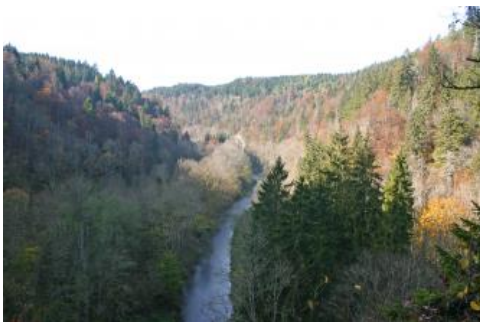
Blick von der Felsengalerie talaufwärts in die Wutachschlucht

Die Wutachschlucht ist eines der geologisch und ökologisch interessantesten Gebiete Baden-Württembergs. Sie gehört zu den Nationalen Geotopen Deutschlands. Vom kristallinen Grundgebirge über die Trias bis zum Jura kann man auf einer Strecke von etwa 30 km einen großen Teil der geologischen Vielfalt Baden-Württembergs entdecken. Grundlegende geologische Prozesse wie Verwitterung, Erosion, Massenverlagerungen und Sedimentation lassen sich hier unmittelbar beobachten. Die Wutachschlucht ist außerdem ein Paradebeispiel für eine junge Flussanzapfung und -umlenkung und dadurch wichtig für das Verständnis der Landschaftsgeschichte. Deshalb ist sie das Ziel zahlreicher geologischer Exkursionen.