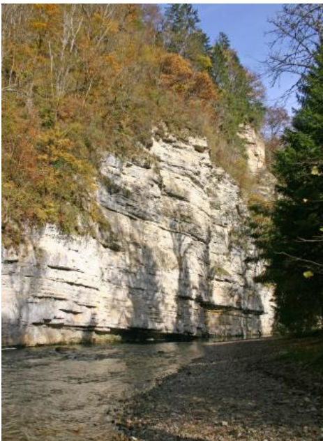
Der Amselfelsen – ein Prallhang der Wutach im Oberen Muschelkalk