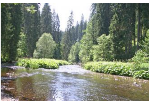
Wutachau und Fichtenwald kurz unterhalb der Einmündung des Rötenbachs

Das tiefe Kerbtal und die Überprägung der Talhänge durch Rutschungen reichen in den Wutachflühen (NSG) bis kurz vor Stühlingen-Grimmelshofen weiter. Auf der Höhe von Blumberg-Fützen queren jedoch die Verwerfungen der Freiburg-Bonndorf-Bodensee-Störungszone das Wutachtal, so dass dieser Abschnitt wieder in den Muschelkalk eingetieft ist. Schließlich mündet die Wutach bei Lauchringen in den Hochrhein.