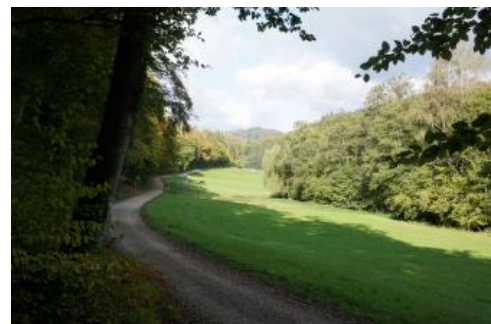
Wollbachtal nördlich von Kandern-Egerten

Der ca. 4,4 km lange Kalkofen-Erlebnispfad befindet sich im Wollbachtal nördlich von Kandern-Egerten. Das Tal liegt im Markgräfler Land, am Westrand der Vorbergzone und verläuft entlang der sogenannten Rheintal-Flexur, welche die Fortsetzung der Schwarzwald-Randverwerfung im südlichsten Oberrheingraben darstellt. Die Gesteinsschichten aus dem Erdmittelalter tauchen, angrenzend an die Buntsandstein-/Rotliegend-Bruchschollen des Weitenauer Berglands, mit steilem Einfallen unter die Tertiärgesteine des Oberrheingrabens ab. Als Folge dieser Lagerungsverhältnisse streichen im Wollbachtal auf engstem Raum unterschiedlichste Gesteine aus den Erdzeitaltern des Juras, Keupers, Muschelkalks und Buntsandsteins aus.