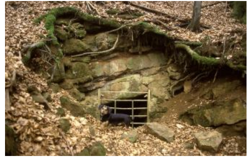
Stollenmundloch in der Murchisonae-Oolith-Formation im Wollbachtal bei Kandern

Im weiteren Verlauf des Weges sind u. a. alte Bergbauspuren in Form von Stollenmundlöchern zu sehen. Sie liegen ebenfalls im Mitteljura, im Niveau von eisenschüssigen Kalksteinen der Murchisonae-Oolith-Formation. Der Eisenabbau lohnte jedoch nicht und wurde bald wieder aufgegeben.