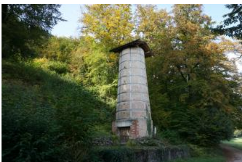
Am Lehrpfad steht der ca. 12 m hohe Kalkofen, in dem früher gebrannter Kalk hergestellt wurde

Der Lehrpfad führt besonders in die Zeit des Juras und zu dessen vor rund 170 Mio. Jahren als Meeresablagerungen entstandenen Gesteinen. Die namensgebende Besonderheit des Lehrpfads ist der 1929 erbaute und vor einigen Jahren restaurierte Kalkofen, in dem früher aus den Kalksteinen des Mitteljuras (Braunjura) Branntkalk hergestellt wurde. Der in einem alten Steinbruch hinter dem Kalkofen zu sehende oolithische Kalkstein gehört zur Hauptrogenstein-Formation. Er wird Hauptrogenstein genannt, weil er sich aus kleinen Kügelchen zusammensetzt, die in ihrem Aussehen an Fischrogen erinnern.