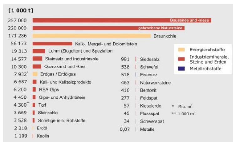
Die Fördermengen an mineralischen Rohstoffen und Energierohstoffen in Deutschland im Jahr 2017 (verändert nach BGR, 2018)

In der Bundesrepublik Deutschland werden jährlich rund 788 Mio. t an festen mineralischen und energetischen Rohstoffen gewonnen. Zusätzlich werden rund 8,3 Mio. Kubikmeter Erdgas, Erdölgas und Grubengas sowie 2,2 Mio. t Erdöl gefördert. Mit rund 533 Mio. t haben Kiese und Sande, gebrochene Natursteine sowie Karbonatgesteine für die Bau- und Zementindustrie den größten Anteil (67,6 %) an der Gewinnung mineralischer Rohstoffe. Die Kiese und Sande stellen mengenmäßig mit 32,2 % fast ein Drittel der Rohstoffförderung in Deutschland; gefolgt von den gebrochenen Natursteinen (27,5 %) und Braunkohle (21,4 %). Die nicht zu den gebrochenen Natursteinen gehörenden Kalk-, Mergel- und Dolomitsteine belaufen sich auf 7 %. Lehm bzw. Ziegelton und Quarzkies und -sand stehen mit einem Anteil an der Förderung von 1,7 % und 1,3 % an fünfter und sechster Stelle. Die Industriemineralien wie Stein- und Kalisalz, Sulfatgesteine, Spezialtone usw. stellen zusammen nur etwa 5 % der Förderung in Deutschland. Die Produktion von Metallen ist mengenmäßig unbedeutend (BGR, 2018).