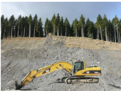
Gewinnung von Opalinuston aus dem Mittleren Jura in der Tongrube Schömberg / Withau

In Baden-Württemberg sind stark tonig-schluffige, schichtige Sedimentgesteinskörper die Grundlage zur Herstellung grobkeramischer Produkte. Feinkeramische Rohstoffe (Porzellanerden, Bentonit) gibt es im Land nicht in bauwürdigen Vorkommen. Als Ziegeleirohstoffe werden Tone und angewitterte Tonsteine, Lösslehme und Lehme verwendet. Wirtschaftlich interessante Ziegeleivorkommen sind solche, die unterschiedlich stark tonige und siltige oder feinsandige Körper auf selber Lagerstätte oder unmittelbar benachbart aufweisen, so dass je nach Produkthanforderung verschiedene Rohstoffmischungen erstellt werden können. Die Tongruben stehen in der Regel unter Bergaufsicht. Ziegeleirohstoffe sind in folgenden geologischen Einheiten vorhanden oder werden derzeit aus diesen gewonnen: (1) Ton- und Mergelsteine des Rotliegenden, Oberen Buntsandsteins, Unteren Muschelkalks, Mittelkeupers, Unterjuras, Mitteljuras (Opalinuston), der Froidefontaine Formation und der Süßwassermolasse, (2) fette Beckentone des Pleistozäns, (3) Lösslehme des Quartärs.