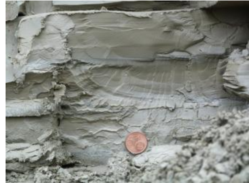
Feinlaminiertes, kompakter, mittelgrauer Bändertone

Der nicht verwertbare Anteil bei der Gewinnung von Ziegeleirohstoffen in Baden-Württemberg betrug im Jahr 2017 rund 4,2 %. Die Angaben zum nicht verwertbaren Anteil der Rohfördermengen von Ziegeleirohstoffen schwanken jedoch in der Regel zwischen 1 % und 12 %. Ungewöhnliche große nicht verwertbare Anteile der Jahre 2013 (42 %) und 2014 (23 %) sind auf eine einzelne Tongrube mit sehr großen und variablen Anteilen an Sand und knolligen Kalkeinschlüssen zurückführbar. Diese Werte sind also nicht repräsentativ für Vorkommen von Ziegeleirohstoffen im Land. Der nicht wirtschaftlich nutzbare Anteil der Rohförderung im Jahr 2017 entspricht in etwa den Werten des Zeitraums 1992–1997. Jedoch gibt es seit 2003 deutliche Schwankungen. Es scheint sich anzudeuten, dass auch bei den Ziegeleirohstoffen die Entwicklung zu steigenden nicht verwertbaren Anteilen aufgrund steigender Anforderungen an die Rohstoffbasis in Form von möglichst mächtigen, homogenen Tonlagern, die sich ohne größeren Aufwand verziegeln lassen, fortschreitet.