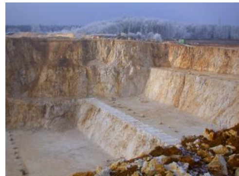
Hochreine Kalkgesteine mit \text{CaCO}_3 -Gehalten von mehr als 98,5 %

Die Rohfördermenge an hochreinen Kalksteinen betrug im Jahr 2017 rund 5,3 Mio. t. Daraus wurden rund 3,6 Mio. t verkaufsfähiger Produkte hergestellt. Die Rohförderung liegt damit im langjährigen Durchschnitt für den Zeitraum 2003–2017 von rund 5,2 Mio. t. Bis ins Jahr 1996 blieb die jährliche Rohfördermenge an hochreinen Kalksteinen deutlich unter 4,0 Mio. t. Schon im Folgejahr stieg die Rohfördermenge jedoch auf über 5,5 Mio. t an und erreichte 2001 einen Wert von fast 6,5 Mio. t. Die Schließung eines Betriebs im Jahr 2002 leitete die Entwicklung der Rohförderung der Jahre 2002–2010 ein, die derer anderer Rohstoffgruppen in diesem Zeitraum gleicht. Dieser ist von zwei Rückgängen der Rohfördermengen und einer dazwischenliegenden, kurzen Erholungsphase gekennzeichnet. Jedoch wird im genannten Zeitraum niemals eine Rohfördermenge von 4,0 Mio. t unterschritten. Im Jahr 2013 stieg die Rohförderung auf fast 6,0 Mio. t, um schon im Jahr 2014 wieder auf rund 5,4 Mio. t zu sinken.