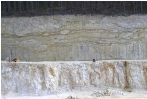
Hochreine Kalksteine im Steinbruch Blaubeuren-Altental

In Baden-Württemberg treten partienweise Kalksteine mit Calcium-Karbonat-Gehalten ( \text{CaCO}_3 ) von über 98,5 % auf. Auf der Schwäbischen Alb (Oberjura) sind die hochreinen Kalksteine sowohl schichtig als auch als abgegrenzte Körper in die Massenkalkfazies (Massenkalk-Formation) eingeschaltet. Es handelt sich dabei um riffartige Schwamm-Mikroben-Bioherme oder um unregelmäßige Schüttungskörper.