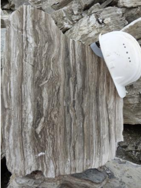
Im Bild ist ein charakteristisch gebänderter Block von Felsensulfat zu sehen. Gipsbruch Deißlingen-Lauffen bei Rottweil

Sulfatgesteine enthalten die beiden Hauptkomponenten Gips ( \text{CaSO}_4 \times 2 \text{H}_2\text{O} ) und Anhydrit ( \text{CaSO}_4 ) in wechselnden Anteilen. Die wirtschaftlich wichtigsten Gipssteinvorkommen liegen in Baden-Württemberg in den 11–20 m mächtigen Grundgipsschichten an der Basis der Grabfeld-Formation (früher: Gipskeuper), von denen max. 8–12 m nutzbar sind, und in der salinaren Heilbronn-Formation des Mittleren Muschelkalks. Sie kommen vor allem in den Regionen Heilbronn-Franken und Schwarzwald-Baar-Heuberg vor. Die Gipssteinlagerstätten, also die derzeit bauwürdigen Vorkommen, konzentrieren sich in den Gebieten Crailsheim – Schwäbisch Hall und Herrenberg – Rottweil. Die Nutzung des geringmächtigen Böhrlingen-Sulfats ist nur zusammen mit dem Gipsstein der überlagernden Grundgipsschichten wirtschaftlich; es kommt im oberen Teil des Unterkeupers im Gebiet zwischen dem Oberen Neckar und der Wutach vor. Anhydritstein bzw. Gips-Anhydrit-Mischgestein wird in Baden-Württemberg nur untertägig im Bergwerk Anneliese bei Vellberg-Talheim (Grundgipsschichten) sowie in der Grube Obrigheim (Mittlerer Muschelkalk) abgebaut. Die Sulfatgesteine werden hauptsächlich in der Bauindustrie (Gipskartonplatten) und als Erstarungsregler in der Zementindustrie eingesetzt.