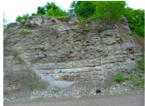
Die Grundgipsschichten mit Felsensulfat (unten) und Plattensulfat (oben) aus dem Mittleren Keuper in der Gipsgrube Vöhringen

Die Rohfördermenge an natürlichen Sulfatgesteinen (Gips- und Anhydritstein) aus über- und untertägiger Gewinnung in Baden-Württemberg betrug im Jahr 2017 rund 1,0 Mio. t. Die derzeitige Rohförderung entspricht somit dem langjährigen Durchschnitt für den Zeitraum 2003–2017 von rund 1,0 Mio. t. Seit dem Jahr 1994, dem bisherigen Höchststand der Förderung an Sulfatgesteinen von rund 1,46 Mio. t, ist die Rohfördermenge um rund 31 % zurückgegangen.