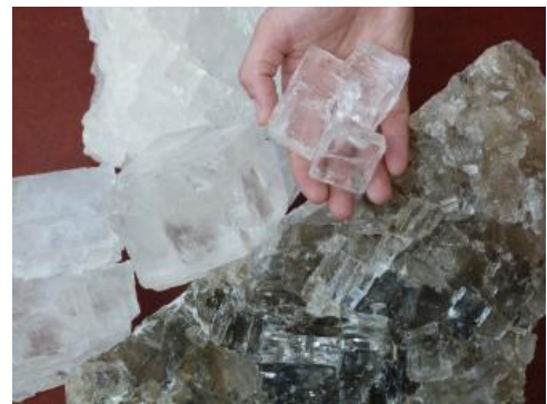
Steinsalz aus dem Steinsalzbergwerk Heilbronn

Die Rohfördermenge an Steinsalz aus untertägiger Gewinnung im Bergwerk oder durch Bohrlochgewinnung in Baden-Württemberg betrug im Jahr 2017 rund 3,2 Mio. t. Daraus wurde eine wirtschaftlich verwertbare Produktmenge von etwas mehr als 3,0 Mio. t hergestellt. Die derzeitige Rohförderung liegt rund 0,8 Mio. t unterhalb des langjährigen Durchschnitts (Zeitraum 2003–2017) von rund 4,0 Mio. t. Die Rohförderung an Steinsalz des Zeitraums 2014–2017 liegt damit etwa auf dem Niveau des Zeitraums 1992–1998, d. h. bei rund 3,0 Mio. t \pm 0,2 Mio. t. Seit dem Jahr 1999 bis ins Jahr 2013 war die Steinsalzförderung von markanten Schwankungen betroffen. In dem genannten Zeitrahmen lag die Rohfördermenge durchgehend über 3,0 Mio. t pro Jahr.