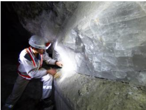
Lage aus Klarsalz im Steinsalzbergwerk Heilbronn

Steinsalz tritt in Südwestdeutschland in schichtiger Form, in sog. Steinsalzlager, auf. Genutzt werden in Baden-Württemberg 10–50 m mächtige Steinsalzlager im tieferen Teil des Mittleren Muschelkalks. Markant sind die Mächtigkeitsschwankungen der o. g. Steinsalzabfolge aufgrund von Subrosion. Im Raum Heilbronn schwanken die Salzmächtigkeiten innerhalb weniger Kilometer zwischen 5 und 60 m. Das wirtschaftlich wichtigste Lager wird als das 5–12 m mächtige „Untere Salz“ oder „Unteres Steinsalz“ bezeichnet. Das Untere Steinsalz ist der Abbauhorizont in Heilbronn und Kochendorf sowie Stetten bei Haigerloch und bei dem durch Solung genutzten Abschnitt am Hoehrhein.