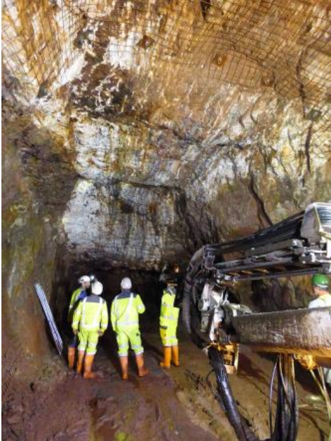
Unter-Tage-Aufnahme aus der Grube Clara mit verzerrem Diagonaltrum

Mineralgänge mit Baryt (Schwerspat, \text{BaSO}_4 ) und Fluorit (Flussspat, \text{CaF}_2 ) treten im Grund- und Deckgebirge des Schwarzwalds und des Odenwalds häufig auf. Die wirtschaftlich interessanten Gänge setzen im Gneis oder in der Randzone zwischen Gneis und Granit auf. Fluss- und Schwerspat bilden meist steil stehende Lagerstättenkörper, die sog. Gänge bzw. Hydrothermalgänge. Entstanden sind diese gangförmigen Körper aus heißen, wässrigen Lösungen, die aus tektonischen Spalten im Gestein aufgestiegen sind und dort ihren Mineralgehalt absetzten. Die größten Spatlagerstätten des Schwarzwalds liegen bei Pforzheim, bei Oberwolfach und anderen Stellen im Kinzigtal, im Münstertal, im Raum Wieden – Todtnau sowie bei St. Blasien. Zurzeit werden Fluss- und Schwerspat nur in der Grube Clara bei Oberwolfach, aus einer Tiefe von 700–850 m gewonnen (Stand Ende 2018). In der Abbildung am Ende der Seite ist der Seigerriss des Schwerspatgangs der Grube Clara schematisch dargestellt.