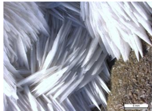
Weißer Schwerspatkristalle aus der Grube Clara

Der größte Teil der weltweiten Schwerspatproduktion wird als Bohrspat zur Dichteregulierung in Bohrspülungen in der Erdöl- und Erdgasindustrie verwendet. Weitere Anwendungsbereiche sind Füllstoffe und Schallschutzmatten in der Automobilindustrie, nicht brennbare Kunststoffe, lichtechte Farben (Lithopone), Papier (Barytpapier), chemische Produkte, strahlungsabsorbierender Schwerbeton, Trinkwasserreinigung und medizinische Diagnostik (Kontrastmittel). Fluorit wird in der chemischen Industrie verwendet, um z. B. Flusssäure herzustellen. Weiterhin wird es zur Produktion von Kryolith genutzt, das bei der Aluminiumerzeugung aus Bauxit als Flussmittel eingesetzt wird. Weitere Verwendungsbereiche liegen in der Keramik- und Glasindustrie, in der Schweißtechnik sowie für Pflanzenschutzmittel und Zahnpasta.