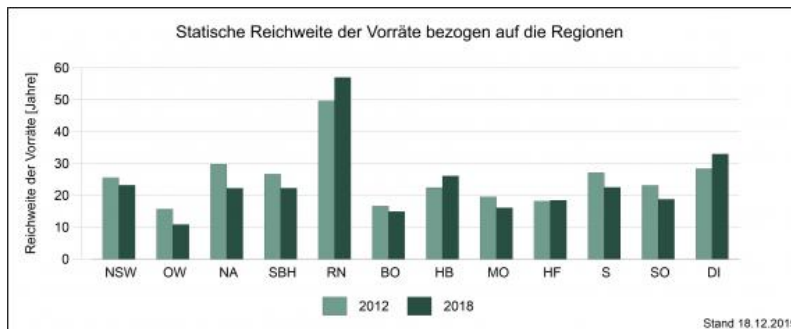
Statische Reichweiten der Rohstoffversorgung in den Planungsregionen Baden-Württembergs im Jahr 2012 und 2018