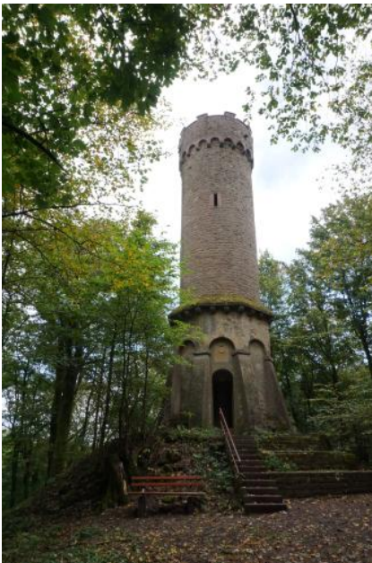
Aussichtsturm auf dem Katzenbuckel

Auf der 626 m ü. NHN hohen Bergkuppe des Katzenbuckels befindet sich ein 18 m hoher, historischer Aussichtsturm aus Buntsandstein. Er wurde bereits 1820 erbaut und bietet einen herrlichen Rundblick in das Ittertal, hinüber zu Taunus, Spessart, Bauland und Kraichgau sowie in das Neckartal. In der näheren Umgebung blickt man auf die vom Oberen Buntsandstein gebildete Hochflächenlandschaft des Hinteren Odenwalds bei Waldbrunn. Der Katzenbuckel ist der höchste Berg des Odenwalds. Er ist der Rest eines kreidezeitlichen Vulkanschlots, der als Härtling der Abtragung im Laufe der Jahrmillionen mehr Widerstand entgegengesetzt hat, als die umgebenden Gesteine. Zum Gipfel führt ein Lehrpfad (Weg der Kristalle), der den Vulkanismus und die Landschaftsentwicklung am Katzenbuckel erklärt.