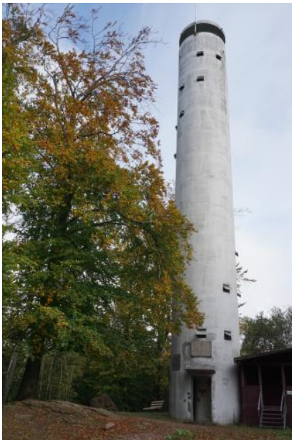
Der Mahlbergturm südöstlich von Malsch

Auf dem Mahlberg (612 m ü. NHN) nordöstlich von Gaggenau-Michelbach wurde als Ersatz eines Vorgängerturms von 1896 ein neuer Aussichtsturm errichtet. Dieser 1966 eingeweihte Turm besteht ganz aus Beton, ist rund 30 m hoch und erlaubt von seiner Aussichtsplattform eine umfassende Sicht in die Rheinebene, zu den Vogesen, zum Pfälzer Wald, in den Kraichgau sowie zum Odenwald und Stromberg. In der näheren Umgebung sind große Teile des Nordschwarzwalds und dessen Abdachung nach Norden gut zu überblicken. Im Nordosten und Osten blickt man über die bewaldeten, von Rodungsinseln durchsetzten Hochflächen, die vom Oberen Buntsandstein gebildet werden und vom Moosalb- und Albtal zerschnitten sind. Die Gipfelbereiche des Mahlbergs und der südöstlich anschließenden Berge (Tannschachberg, Mauzenberg) werden vom Mittleren Buntsandstein gebildet. Sie sind tektonisch herausgehoben und durch die Bernbacher Verwerfung von den Hochflächen im Osten getrennt.