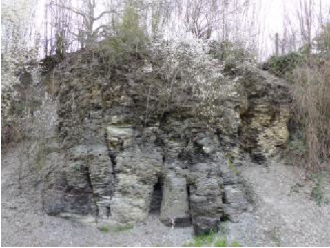
Ausschnitt der Posidonienschieferwand in Bad Schönborn-Langenbrücken

Bad Schönborn liegt inmitten der Langenbrückener Senke, so benannt nach dem Ortsteil Langenbrücken. Diese geologische Struktur entstand im Zuge der Einsenkung des Oberrheingrabens und liegt zwischen Wiesloch, Östringen und Bruchsal, am westlichen Rand des Kraichgaus. Sie besteht aus mehrfach zerstückelten Bruchschollen, die bei der Absenkung am Grabenrand verhakten und in unterschiedlichen Tieflagen erhalten blieben. Hier um Bad Schönborn-Langenbrücken sind es Ablagerungen des Unter- und Mitteljuras, die zwischen Keuperschollen eingesunken sind.