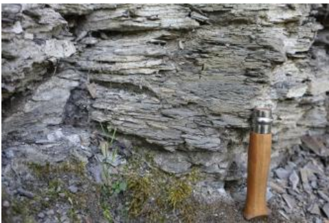
Feinschichtiger Tonmergelstein an der Posidonienschieferwand in Bad Schönborn-Langenbrücken

Seelilien), die in der Posidonienschiefer-Formation im Vorland der Schwäbischen Alb bei Holzmaden und Dotternhausen gefunden wurden, sucht man hier leider vergeblich.