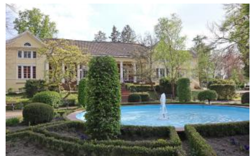
Das Kurhaus Sigel im Kurpark von Bad Langenbrücken

Bad Langenbrücken verdankt seinen Status als Heilbad den Schwefelquellen, die in der Nähe entspringen. Durch oberflächennahe Gewässer, die in den zerklüfteten Schichten der Ölschiefer zirkulieren, wird feinstverteilter Pyrit oxidiert, durch Bakterien in Schwefelwasserstoff umgewandelt und im Wasser gelöst. Das deutlich nach Schwefel riechende Heilwasser findet seine Anwendung vor allem bei rheumatischen Erkrankungen, Ischias-Beschwerden, Gicht und Wirbelsäulenerkrankungen. Nördlich von Östringen gibt es im Krummbachwald eine weitere bekannte Schwefelquelle mit Einzugsgebiet im Unterjura.