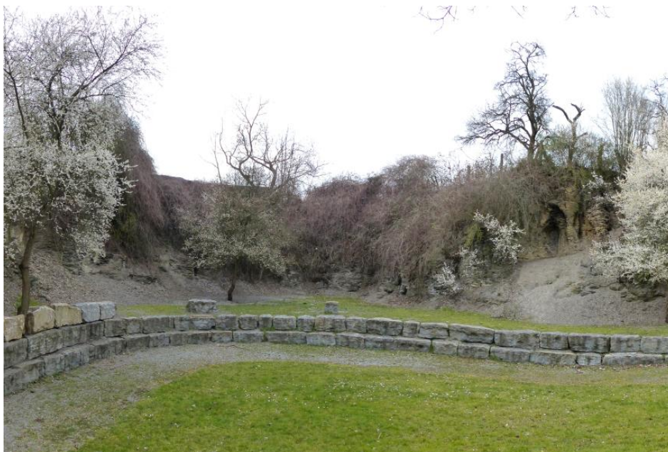
Posidonienschieferwand (aufg. Steinbruch) in Bad Schönborn-Langenbrücken