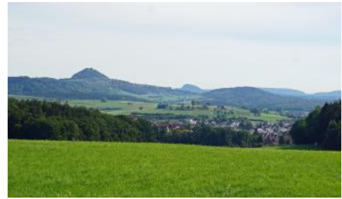
Albvorland bei Rechberghausen mit Unterjura-Hügelland, bewaldeten Rücken im Mitteljura und den Oberjura-Zeugenbergen Hohenstaufen (links) und Stuifen (Mitte); rechts im Hintergrund ist der Albtrauf zu sehen.

Vermutlich nicht zuletzt durch die tektonische Zerrüttung bedingt, finden sich am Hohenstaufen und Rechberg ehemalige Rutschungen in Form abgeglittener Gesteinsschollen. Eine sehr alte, vermutlich vor rund 2,5 Mio. Jahren abgerutschte Gleitscholle ist die sog. Spielburg-Scholle am südwestlichen Anstieg des Hohenstaufens (Hönig, 1984). Sie stellt neben dem Berggipfel ein weiteres lohnendes Ziel dar und bietet ebenfalls eine hervorragende Aussicht. Bankkalke und Massenkalke des Mittleren Oberjuras, die heute auf dem Berggipfel nicht mehr anstehen, sind dort mehr oder weniger im Verband abgeglitten und in einem ehemaligen Steinbruch aufgeschlossen, an den sich hangabwärts große Mengen an Oberjura-Blockschutt anschließen. Aufgrund des Artenreichtums und der seltenen Lebensräume ist der Bereich heute als Naturschutzgebiet ausgewiesen (Kreh, 2007af; siehe auch weiterführende Links).