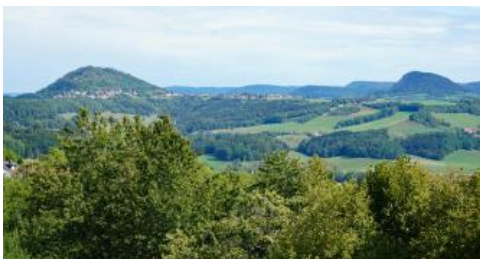
Im Osten des Hohenstaufens erblickt man die beiden anderen „Kaiserberge“ Rechberg und Stuißen. Die Bergkegel aus Oberjurgestein erheben sich beide auf einem schmalen von der Eisensandstein-Formation gebildeten Plateau.

Hohenstaufen, Rechberg und Stuißen, im Albvorland zwischen Göppingen und Schwäbisch Gmünd gelegen, werden auch als die drei Kaiserberge bezeichnet. Die im 11. Jh. auf dem Hohenstaufen errichtete mittelalterliche Burg, von der nur noch wenige Mauerreste zu sehen sind, war bis zur Mitte des 13. Jh. Stammburg der Stauer. Besser erhalten ist die Ruine Hohenrechberg, die zur Stauerzeit errichtete Stammburg der Grafen von Rechberg. Zusätzlich wird das Gipfelplateau des Rechbergs durch die barocke Wallfahrtskirche St. Maria geprägt. Unbebaut und größtenteils bewaldet ist dagegen der Stuißen, der mit 757 m ü. NHN der höchste der drei Kaiserberge ist.