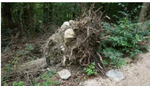
Wurzelteller mit Oberjura-Hangschutt am Oberhang des Hohenstaufens

Die Berghänge sind überall bis weit hinab von eiszeitlichen Schuttdecken aus hellen Oberjura-Kalksteinen und -Mergel bedeckt. Die Böden sind meist flachgründig und stark erodiert, da die Berge nicht immer eine schützende Walddecke getragen haben, sondern als Weideland dienten. Im Vorwort der 1886 erschienenen romantischen Erzählung von A. v. Wolkenstein heißt es: „Wohl der kahlste und ödeste von allen Gipfeln der Alb ist der Stuifen bei Gmünd, der unholde Nachbar des frommen freundlichen Rechbergs und des ernsten gedankenvollen Hohenstaufens. „Dieses grinsende Steingerippe mitten in einer blühenden Landschaft“ fiel einmal einem Reisenden aus Norden so sehr auf, daß er nach freier Phantasie eine Geschichte darüber schrieb...“ (Zitat aus: Rothenberger, 2016, S. 38). Ende des