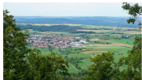
Blick über die nördlich des Hohenstaufens gelegenen Unterjura-Platten bei Wäschenbeuren und das Remstal hinweg ins Keuperbergland des Welzheimer Walds

Von den Gipfelplateaus des Hohenstaufens und des Rechbergs genießt man einen Rundblick zur Schwäbischen Alb, über das Albvorland zwischen Fils- und Remstal bis weit hinein in die im Norden und Westen angrenzenden Keuper-Waldberge (Welzheimer Wald, Schurwald). Auf der Höhe des Rechbergs endet der Geologische Pfad Schwäbisch Gmünd–Hohenrechberg. Auf der Westseite des überwiegend bewaldeten Stuifen befindet sich eine Freifläche mit Schutzhütte und Grillplatz. Von dort hat man eine schöne Aussicht nach Südwesten und Süden auf das Albvorland und die Alb sowie nach Nordwesten auf die Ausläufer des Schurwalds.