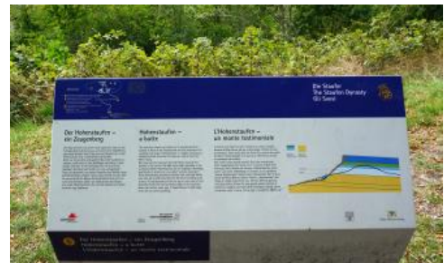
Geologische Informationen am Aussichtspunkt auf dem Hohenstaufen

Vermutlich nicht zuletzt durch die tektonische Zerrüttung bedingt, finden sich am Hohenstaufen und Rechberg ehemalige Rutschungen in Form abgeglittener Gesteinsschollen. Eine sehr alte, vermutlich vor rund 2,5 Mio. Jahren abgerutschte Gleitscholle ist die sog. Spielburg-Scholle am südwestlichen Anstieg des Hohenstaufens (Hönig, 1984). Sie stellt neben dem Berggipfel ein weiteres lohnendes Ziel dar und bietet ebenfalls eine hervorragende Aussicht. Bankkalke und Massenkalke des Mittleren Oberjuras, die heute auf dem Berggipfel nicht mehr anstehen, sind dort mehr oder weniger im Verband abgeglitten und in einem ehemaligen Steinbruch aufgeschlossen, an den sich hangabwärts große Mengen an Oberjura-Blockschutt anschließen. Aufgrund des Artenreichtums und der seltenen Lebensräume ist der Bereich heute als Naturschutzgebiet ausgewiesen (Kreh, 2007af; siehe auch weiterführende Links).