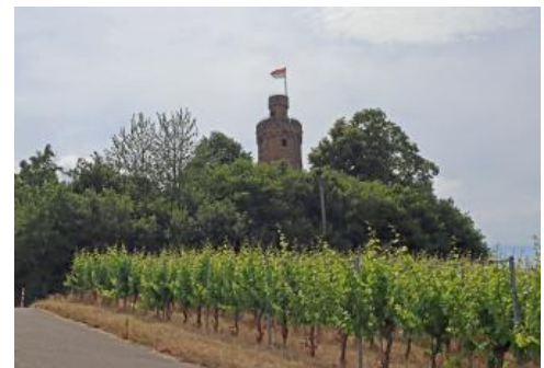
Der Aussichtsturm auf der Heuchelberger Warte bei Leingarten-Großgartach

Der Aussichtsturm auf der Heuchelberger Warte hat eine lange Geschichte. Erbaut 1483 als Wartturm durch Graf Eberhard im Bart sollte er den Württembergischen Landgraben bewachen, der vom Heuchelberg bis in die Löwensteiner Berge reichte und Landes- sowie Zollgrenze war. Nachdem 1806 die Gebiete nördlich des Landgrabens in das neue Königreich Württemberg eingegliedert wurden, verloren Graben und Turm ihre Bedeutung als Grenzbefestigung. Der verfallende Turm wurde 1898 erstmals restauriert und als Aussichtsturm genutzt. Nach umfangreichen Renovierungsarbeiten ab 2000 konnte er 2002 wieder freigegeben werden.