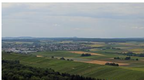
Kraichgau-Landschaft mit Schwaigern und dem Steinsberg

Von dem 20 m hohen Turm erhält man eine gute Aussicht über die Weinberge am Ostabfall des Heuchelbergs auf das Zabergäu, das Neckartal mit Heilbronn und die östlich anschließende Keuperschichtstufe mit den Löwensteiner Bergen. In nördliche Richtung geht der Blick über das Lösshügelland des Kraichgaus bis zum Katzenbuckel, der höchsten Erhebung des Odenwalds. Im Nordwesten erkennt man den ebenfalls aus Vulkangestein aufgebauten Steinsberg mit der Burg im Zentrum des Kraichgaus.