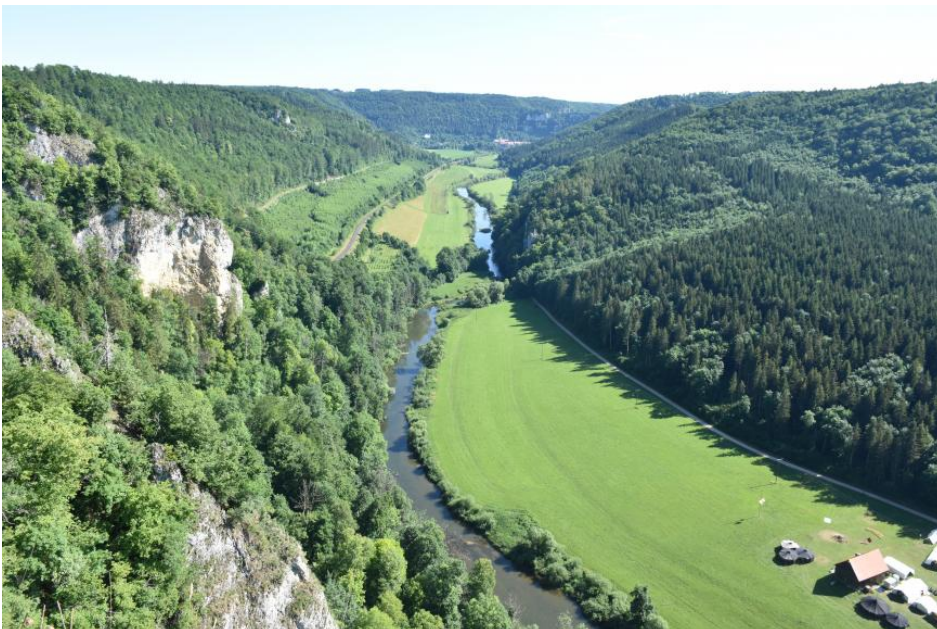
Blick vom Knopfmacherfels nach Nordnordosten durchs Donautal nach Beuron