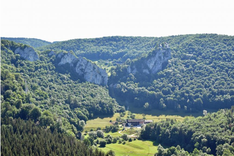
Massenkalkfelsen mit dahinter liegender Zementmergelschüssel bei Schloss Bronnen östlich von Fridingen an der Donau

Der Knopfmacherfels, ein Felsvorsprung im Unteren Massenkalk hoch über dem Donautal nordöstlich von Fridingen, gewährt von seiner Aussichtsplattform einen hervorragenden Überblick über das Donautal bis nach Beuron sowie zur gegenüberliegenden Talseite, wo hinter hohen Felsbildungen, die vom Schloss Bronnen gekrönt werden, eine ausgeräumte Zementmergelschüssel zu sehen ist. Die im Jurameer zwischen den Schwammriffen schüsselförmig abgelagerten Mergelschichten der Zementmergel-Formation wurden von der Donau und ihren Zuflüssen während ihrer Eintiefung bevorzugt ausgeräumt, da sie im Vergleich zum harten Kalkstein leichter abzutragen waren. Somit wurde gewissermaßen das frühere untermeerische Relief wieder freigelegt.