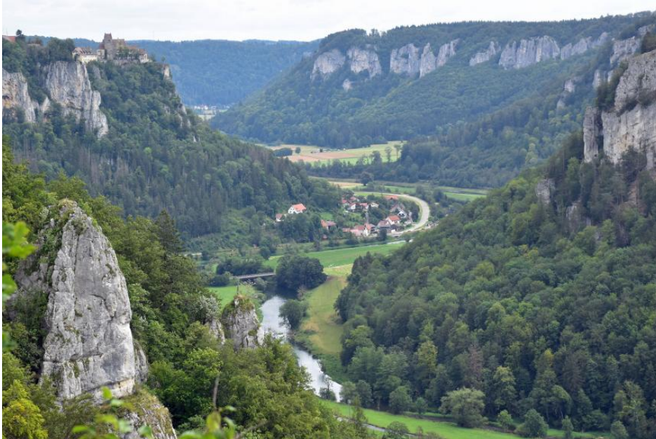
Blick vom Eichfels nach Nordosten durch das Obere Donautal mit seinen Felskränzen aus Schwammkalken des Oberjuras

Viele der Felsen aus Oberjura-Massenkalk, die in großer Zahl die Talhänge des Oberen Donautals säumen sind gleichzeitig auch gute, durch Wanderwege erschlossene Aussichtspunkte. Stellvertretend seien hier zwei von der Hochfläche aus bequem erreichbare Aussichtsfelsen genannt: der Knopfmacherfels bei Fridingen und der Eichfels bei Irndorf.