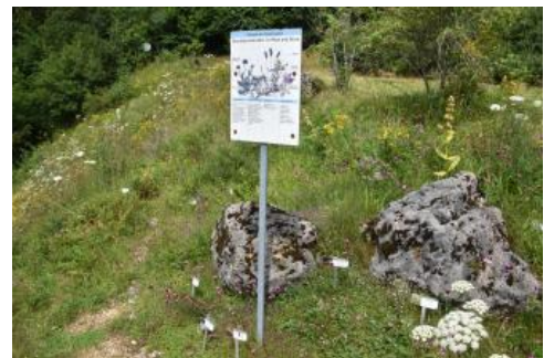
Der Irndorfer Felsengarten in der Nähe des Aussichtspunktes am Eichfelsen

In unmittelbarer Nähe des Aussichtspunktes auf dem Eichfelsen befindet sich der Irndorfer Felsengarten. Dort sind die an die besonderen Standortbedingungen der Felsen und Schutthalden angepassten Pflanzen aus nächster Nähe zu sehen.