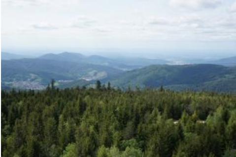
Blick vom Hohlohturm nach Nordwesten über das Murgtal

Nordwestlich des Hohlohturms liegt der überwiegend aus Forbach-Granit aufgebaute Grundgebirgs-Schwarzwald auf beiden Seiten des Murgtals sehr nahe. Die Siedlungen sind von Obstwiesen umgeben und Schloss Eberstein erhebt sich über den Rebhängen. Ab Gernsbach sind dann Konglomerate aus dem Rotliegenden die bestimmenden Gesteine und das Murgtal weitet sich auf. Als Einzelberge erkennt man den Battert westlich von Baden-Baden und den Schlossberg von Ebersteinburg. Sie werden jedoch teilweise vom Kleinen Staufenberg und dem 668 m ü. NHN hohen Merkur mit seinem Turm verdeckt. Beide bilden einen weit nach Westen vorgeschobenen Auslieger aus Buntsandstein (Eck-Formation und Badischer Bausandstein) über Zechstein-Sedimenten (Kirnbach- und Tigersandstein-Formation). In dem stark durch Verwerfungen