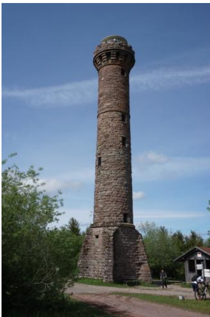
Der Hohlohturm bei Gernsbach

Der Hohlohturm liegt knapp 9 km südöstlich von Gernsbach auf der Gemarkung von Reichental im nördlichen Buntsandstein-Schwarzwald am Westrand der Enzhöhen. Der aus Buntsandstein erbaute Turm erhebt sich in 984 m ü. NHN etwa 400 m nördlich des Moorebiete der Hohlohmüß (Naturschutzgebiet Kaltenbronn). Der früher auch Kaiser-Wilhelm-Turm genannte Bau wurde 1897 vom Schwarzwaldverein erstellt und 1968 auf seine heutige Höhe von 28 m gebracht.