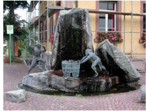
Bergmannsbrunnen in Schnellingen bei Haslach im Kinzigtal

Weitere Informationen finden sich bei Bliedtner & Martin (1986), Huth & Nitsch (2019) sowie Werner & Dennert (2004).