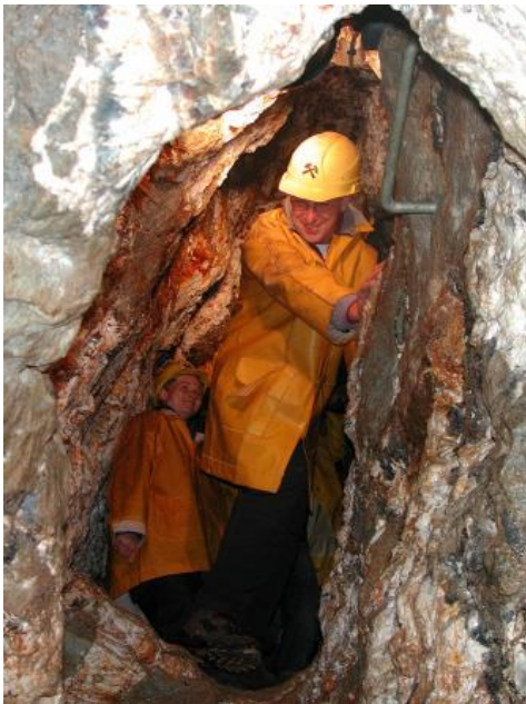
In der Grube „Segen Gottes“ bei Haslach im Kinzigtal

Die Grube Segen Gottes liegt im Mittleren Schwarzwald, nördlich der Kinzig in einem Seitentälchen im Ortsteil Schnellingen etwa einen Kilometer von der Altstadt von Haslach entfernt. Der Bergbau im Kinzigtal ist bereits seit dem 13. Jahrhundert dokumentiert. Der Silberbergbau „am Schnellling“ ist in einer Urkunde von 1491 belegt. Die Hauptphase des Bergbaus war im 15. und 16. Jahrhundert. Von 1711–86 gab es mehrere, letztlich erfolglose Versuche, die Grube Segen Gottes weiter zu betreiben.