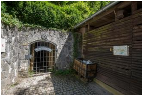
Eingangsbereich des Besucherbergwerks Grube Wenzel bei Oberwolfach

Der Bergbau im Wolfacher Bergbaurevier im Mittleren Schwarzwald hat eine Tradition, die weit in das Mittelalter zurückreicht. Die Grube Wenzel wurde schon vor 1700 erschlossen. Die Hochphase des Bergbaus mit einer ertragreichen Silbererzförderung war zwischen 1760 und 1823. Insgesamt wurden in diesem Zeitraum aus den Erzen der Grube rund 4 t Silber, 400 kg Kupfer und 850 kg bleihaltige Produkte gewonnen. In einem steil stehenden Baryt-Calcit-Gang, dem Wenzelgang, finden sich neben Schwerspat, Calcit und Quarz u. a. Silber-Antimonerze, Eisenkarbonate, Fahlerz, Kobalt- und Nickelerze. Beim umgebenden Gestein handelt es sich um Paragneis, der von Granit- und Pegmatitgängen durchzogen ist (Werner & Dennert, 2004).