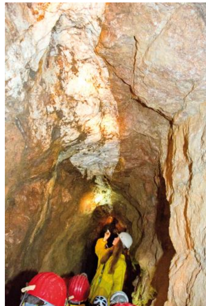
Besucherbergwerk Grube Wenzel bei Oberwolfach; Foto: Gemeinde Oberwolfach