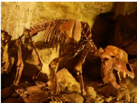
Ein Bärenskelett im hinteren Teil der Bärenhöhle weist auf die zahlreichen Bärenknochen hin, die dort gefunden wurden.

Auf der verkarsteten, aus Karbonatgestein des Oberjuras aufgebauten Schwäbischen Alb sind Höhlen kein seltenes Phänomen (Binder & Jantschke, 2003). Eine der bekanntesten Höhlen Deutschlands und sicher die bekannteste der Schwäbischen Alb ist die auf der Kuppenalb bei Sonnenbühl-Erfingen gelegene Bärenhöhle. Sie besteht eigentlich aus zwei Höhlen, der seit 1834 bekannten Karlshöhle und der erst 1949 entdeckten Bärenhöhle. Heute sind beide Höhlen zu einer Besucherhöhle vereinigt. Die Höhle entstand im Unteren Massenkalk des Oberjuras (früher Weißjura delta). Anhaltende Hebung und der Wechsel von Kalt- und Warmzeiten führten im Pleistozän zur Eintiefung der Täler. Damit war ein Absinken des Karstwasserspiegels verbunden, mit der Folge, dass immer mehr Seitentäler oder auch jungtertiäre Karsthöhlen wie die Bärenhöhle trockenfielen. Aus der ehemaligen Wasserhöhle, deren Entwicklung rund 5 Mio. Jahre zurückreicht (Abel et al., 2006), wurde so eine inaktive Höhle mit