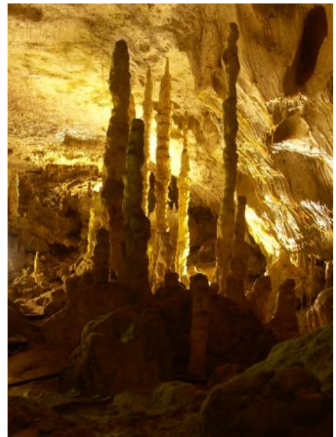
Stalagmiten in der Bärenhöhle bei Sonnenbühl- Erpfingen