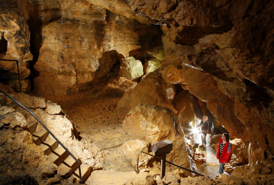
Laichinger Tiefenhöhle – Große Halle in 40 m Tiefe; Foto: A. Schober/Archiv Höhlen- und Heimatverein Laichingen