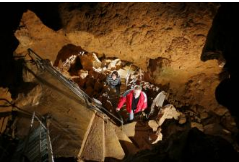
Laichinger Tiefenhöhle – Abstieg in die Kleine Halle in 55 m Tiefe

Der Besucher steigt heute über eine Metalleiter 40 m in die Tiefe in die erste „Große Halle“, dann weiter in die 55 m tief gelegene „Kleine Halle“. Hier ist nun der tiefste für Besucher zugängliche Punkt erreicht. An den Wänden finden sich Versinterungen, die leider zu großen Teilen von unverständigen Besuchern früherer Jahre abgeschlagen wurden. In der großen Halle sieht man deutliche Spuren des ehemaligen Höhlenbachs, der glattgeschliffene Röhren und mehrere Kolke hinterlassen hat. Sickerwasser, das sich heute im Bereich der Höhle sammelt, fließt in einem unterirdischen Höhlensystem nach Süden und tritt im 10 km entfernten Blautopf, der zweitgrößten Karstquelle der Schwäbischen Alb, wieder zutage.