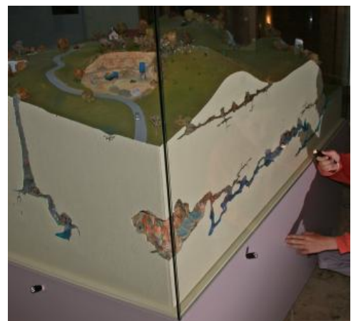
Modell der Laichinger Tiefenhöhle; Foto: A. Schober/Archiv Höhlen- und Heimatverein Laichingen

Über der Höhle befindet sich das Laichinger Museum für Höhlenkunde.