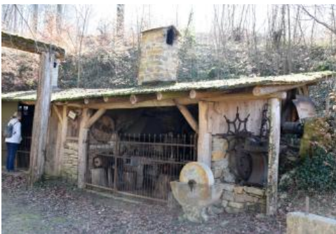
Im Freilichtmuseum „Historische Steinbrüche Pfaffenweiler“

Das am südöstlichen Ortsrand in den beiden letzten erhaltenen Steinbrüchen gelegene Freilichtmuseum „Historische Steinbrüche Pfaffenweiler“ wurde 1985 eröffnet. Auf dem Gelände sind Rekonstruktionen einer Steinhauerhütte und einer Bildhauerwerkstatt samt Werkzeugen sowie mehrere Erzeugnisse wie Grabsteine, Bildstöcke, Torbögen und andere Werkstücke aus Kalksandstein zu sehen. Auch eine Gleisanlage für Loren wurde verlegt. Ein Rundweg führt die Besucher durch das Steinbruchareal. Das Freilichtmuseum ist Teil des Dorfmuseums, das im Rathaus untergebracht ist und ebenfalls Objekte der Steinhauer- und Steinmetztradition zeigt. Dort ist auch der Abguss des Unterkiefers eines ca. 35 Mio. Jahre alten Urpferdchens ( Palaeotherium magnum ) ausgestellt, das um 1838 im Pfaffenweiler Kalksandstein gefunden wurde. Das Original befindet sich im