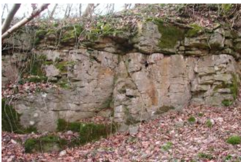
Aufgelassener Steinbruch im Pfaffenweiler Kalksandstein (Küstenkonglomerat-Formation)

Der Pfaffenweiler Kalksandstein entstand in der Zeit des älteren Tertiärs, als große Teile des Oberrheingrabens von einem Meeresarm bedeckt waren. In dessen östlicher Küstenregion wurden Sedimente aus dem Verwitterungsschutt der sich randlich heraushebenden Hochgebiete abgelagert. Zum großen Teil handelt es sich dabei um Kalkkonglomerate, die in der Geologischen Karte als Küstenkonglomerat-Formation ausgewiesen sind. Ihr größter Ausstrichbereich liegt in der Vorbergzone zwischen Freiburg i. Br. und Badenweiler. Die groben Konglomerate, wie sie zum Beispiel im Burggraben der beim Nachbarort Ebringen auf dem Schönberg gelegenen Ruine Schneeburg aufgeschlossen sind, können Gerölle mit einem Durchmesser von bis zu 1 m enthalten. Typisch ist eine Wechsellagerung mit feineren Sedimenten unterschiedlicher