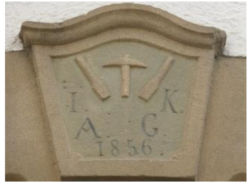
Aus Pfaffenweiler Kalksandstein gefertigtes Türschild am Haus einer Steinhauerfamilie.