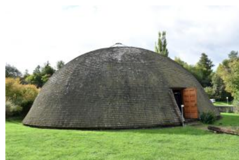
Der heute als Ausstellungsraum genutzte Holz-Rundbau im Salinenmuseum Rottweil stand früher über einem der Sole-Speicherbecken.

Die Salzgewinnung und der Salzexport wurden im 19. Jh. einer der wichtigsten Wirtschaftszweige in Rottweil. Im Jahre 1969 stellte die Saline ihren Betrieb ein. Bald darauf gründete sich in Rottweil ein Solebadförderverein, der 1981 ein Museum über die Salzgewinnung einrichtete. Seit 1986 wird das Museum vom Förderverein Salinenmuseum Rottweil e. V. betreut. Es ist im Hauptgebäude des Unteren Bohrhauses untergebracht, das 1826 erbaut und 1833 an den jetzigen Platz versetzt wurde. Ausstellungsraum ist einer der Rundbauten, die als Solebehälter auf der Anhöhe zwischen Prim- und Neckartal standen, und der 1983 zum Museum versetzt wurde.