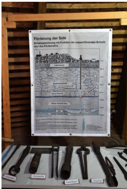
Geologisches Profil und Werkzeuge im Ausstellungsraum des Salinenmuseums in Rottweil

Während der Ablagerungszeit des Mittleren Muschelkalks vor rund 240 Mio. Jahren existierte im mitteleuropäischen Raum ein flaches Nebenmeer, dessen Wasseraustausch mit dem Weltmeer sehr gering war und das zeitweise ganz von diesem abgetrennt war. In den Zeiten mit dem geringsten Meerwassernachstrom wurde bei starker Verdunstung unter dem damaligen subtropischen Trockenklima Gips und Steinsalz abgeschieden und das Nebenmeer entwickelte sich zeitweise zu einer trockengefallenen Salzpfanne. Durch den zwar stark eingeschränkten, aber andauernden bzw. wiederholten Nachstrom von Meerwasser konnte sich dabei ein viele Meter mächtiges Salzlager absetzen.