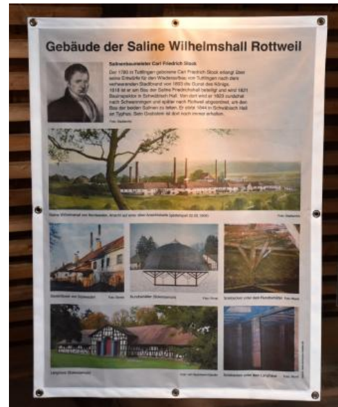
Info-Plakat zu den ehem. Gebäuden der Saline Wilhelmshall – Salinenmuseum „Unteres Bohrhaus“, Rottweil

Nachdem man bereits im Jahr 1822 im benachbarten badischen Dürrheim abbauwürdige Steinsalzlager erbohrt hatte, wurde man 1823 auch im württembergischen Schwenningen und 1824 in Rottweil in 114 m Tiefe fündig, woraufhin man dort die Saline Wilhelmshall einrichtete. Mit dem durch die Bohrlöcher eindringenden Wasser setzte die Auflösung der rund 10 m mächtigen Salzschiebe ein. Die mit der Wasserkraft des kleinen Flusses Prim angetriebenen Pumpen förderten das salzhaltige Wasser nach oben. Über hölzerne Rohrleitungen (Deicheln) wurde die Sole zunächst in Zwischenlager geleitet und von dort bei Bedarf den Siedehäusern zugeführt. Um das Salz auch bergmännisch zu gewinnen, hat man in den Jahren 1842–1850 versucht, einen Schacht abzuteufen. Wegen wiederholter Wassereinbrüche musste das Unternehmen aber wieder eingestellt werden (Schmidt et al., 1982).