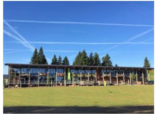
Das Haus der Natur auf dem Feldberg; Foto: Stefan BÜchner

Weiterführende Informationen finden sich in Regierungspräsidium Freiburg (2012a).