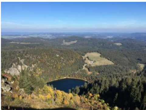
Blick vom Feldberg (Seebuck) über den Feldsee nach Nordosten; Foto: Stefan Büchner

Der überwiegend von Gesteinen des Grundgebirges aufgebaute Südschwarzwald ist der höchste, am stärksten herausgehobene Teil des Schwarzwalds (Feldberg 1493 m ü. NHN). In der Feldbergregion dominieren gneisähnliche Gesteine, z. T. sind auch Granite verbreitet. In den Kaltzeiten des Pleistozäns hat das Gebiet eine starke Überformung durch die Vergletscherung erfahren. Es entstanden die Becken, die heute vom Titisee und Schluchsee erfüllt sind. Das Feldseekar, Trogtäler, Rundhöcker und vermoorte Senken sowie Moränen- und Schmelzwasserablagerungen sind weitere Zeugen der Eiszeit.