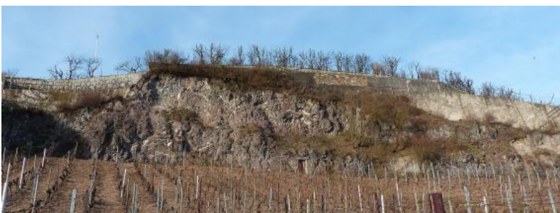
Vulkangestein an der Fohrenberg-Südspitze bei Ihringen