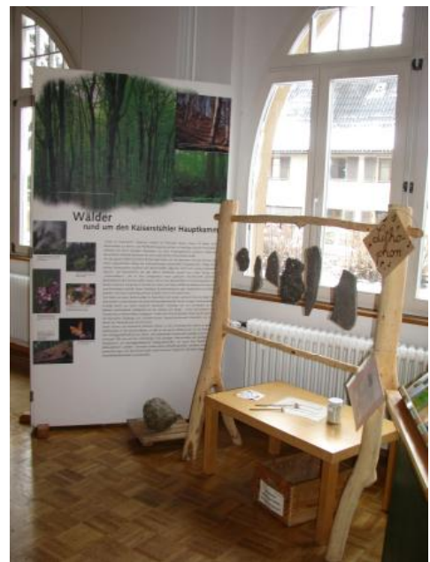
Im Naturzentrum Kaiserstuhl – rechts das Lithophon; Foto: B. Sütterlin, Naturzentrum Kaiserstuhl