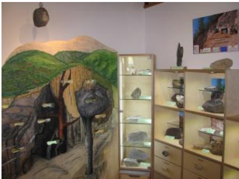
Geologie-Exponate im Naturzentrum Kaiserstuhl in Ihringen

Der Kaiserstuhl als mediterrane Insel im Oberrheingraben ist seit vielen Jahren eine bevorzugte Ferienregion, die durch einmalige Natur, exquisiten Wein und gemütliche Gastlichkeit jedes Jahr Tausende von Besuchern anzieht. Er ist aber auch eine Region, in der, bedingt durch Klima, Geologie, Böden und Nutzungsgeschichte, viele wertvolle Standorte mit einer Vielzahl seltener und gefährdeter Pflanzen und Tiere vorkommen.