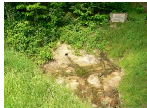
Der Murr-Ursprung am südöstlichen Ortsende von Vorderwestermurr

Der als Naturdenkmal geschützte Murr-Ursprung (Murrquelle) befindet sich im Keuperbergland in einer kleinen Senke am südöstlichen Ortsende von Murrhardt-Vorderwestermurr. Der halbseitig ummauerte Quelltopf, der mit einem künstlich angelegten Ablaufgraben versehen ist, zeigt Fleinsbänke aus der unteren Löwenstein-Formation (Stubensandstein) des Mittelkeupers. In dem anstehenden Fleins sind mehrere parallele, etwa Ost-West-streichende, offene Vertikalklüfte zu sehen, aus denen das Quellwasser austritt. An der beständig fließenden Murrquelle hatten die Menschen bereits vor ca. 8000 Jahren, in der Steinzeit, einen Rastplatz. Nach etwa 125 m in einem schmalen Kerbtälchen fließt das Wasser in einen kleinen Bach, der von der Südostseite des Hoblersbergs kommt. Dies ist der längere Quellast mit einem deutlich größeren Einzugsgebiet. Am Unterhang des Hoblersbergs findet sich eines der wenigen flächenhaften Vorkommen von Quellengleyen in den Schwäbisch-Fränkischen-Waldbergen. Der Fautsbach kommt mit einer schmalen Talau aus südwestlicher Richtung dazu. Kurz vor der Einmündung durchschneiden beide Bäche den harten Stubensandstein und laufen dann als junge Murr in einem sich rasch eintiefenden Kerbtal zur Fornsbacher Talspinne. In der zunächst lückenhaften engen Talsohle überwiegen grundwassernahe Auengleye als Bodenbildungen.