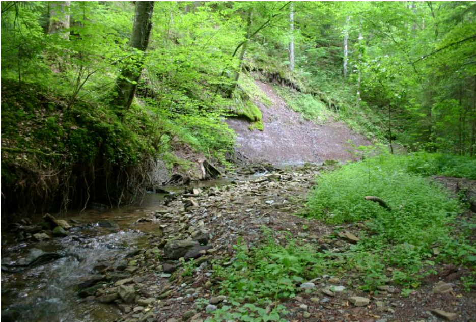
Im oberen Murratal

Weitere Informationen finden sich bei Eisenhut (1971a).