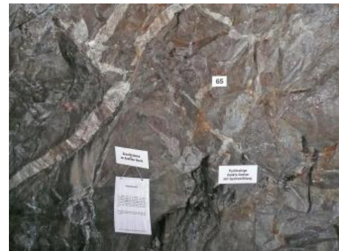
Dunkle pyritthaltige Gneise (Todtmoos-Gneisanatexit-Formation) mit hellen Ganggraniten im Besucherbergwerk Hoffnungsstollen in Todtmoos-Mättle

Die im Bereich des Hoffnungsstollens verbreitete Todtmoos-Gneisanatexit-Formation besteht überwiegend aus hellen und feinkörnigen Paragneisen (Südschwarzwald-Gneis-Gruppe). Im nordwestlichen Teil kommt weißer Gneis („Leptinit“) vor, der im Kambrium vor etwa 580 Mio. Jahren aus hellen, sauren Vulkaniten entstanden ist. Dunkle, pyritthaltige Gneise sind in einzelnen Schollen im Tiefstollen zu sehen. Das dunkle, basische Erzmuttergestein stammt von magmatischen Tiefengesteinen (Norit, Gabbro) ab, die an der Wende vom Devon zum Karbon an einem mittelozeanischen Rücken aufdrangen. Die Gneise und erzhaltigen Gesteine wurden während der variskischen Gebirgsbildung abgesenkt und in der Zeit von 342–334 Mio. Jahren von der Wiese-Wehra-Decke überfahren. Die Erdkruste wurde dabei eingeeignet und unter hohem Druck und bei hohen Temperaturen kam es zu einer Durchbewegung und teilweisen Aufschmelzung (Anatexis) sowie zur Zerlegung der Gesteinspakete in Schollen und Schuppen. Der Hauptstollen reicht bis in den hellgrauen St. Blasien-Granit, der bei der folgenden Ausdehnung der Erdkruste als Gesteinsschmelze zwischen den Gneisen seinen Platz einnahm. Granitgänge finden sich auch in den Gneisen. Im jüngeren Erdmittelalter und während des Tertiärs entstanden weitere steilstehende Störungen und tonig verwitternde Ruschelzonen. Insgesamt können im Hoffnungsstollen über 500 Mio. Jahre Erdgeschichte besichtigt werden.