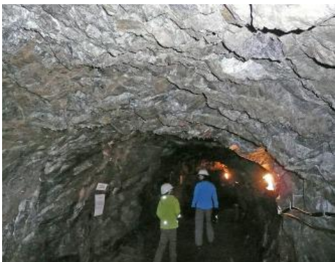
Besucher im Hoffnungsstollen in Todtmoos-Mättle

Die Magnetkies- und Nickelerzgrube Hoffnungsstollen in Todtmoos-Mättle im Südschwarzwald wurde erstmals 1799 urkundlich erwähnt. Bis zur Stilllegung der Vitriolhütte im Ortsteil Berghütte 1835 wurde in größeren Mengen Magnetkies im Tagebau abgebaut und verarbeitet. Erst danach wurde erkannt, dass das bisher als Abfall verworfene Nickelerz zur Stahlhärtung verwendet werden kann. Es wurde im 19. und Anfang des 20. Jahrhunderts in kleinen Mengen und mit Unterbrechungen erschürft. Weitergehende bergmännische Untersuchungen hatten jedoch nicht den erhofften Erfolg. Da man trotz großer Anstrengungen in den Jahren 1934 bis 1937 keine abbauwürdigen Erznestern fand, wurden die Arbeiten 1937 endgültig eingestellt und die Grube aufgegeben.