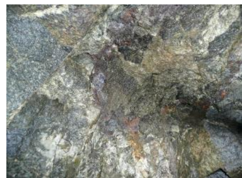
„Erzmuttergestein“ im Besucherbergwerk Hoffnungsstollen in Todtmoos-Mättle

Weiterführende Informationen finden sich bei Metz (1980), Sawatzki (2003) sowie Werner & Dennert (2004).