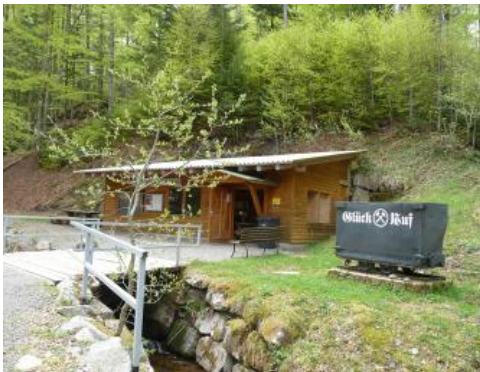
Grubenhütte am Besucherbergwerk Hoffnungsstollen in Todtmoos

Die Magnetkies- und Nickelerzgrube Hoffnungsstollen in Todtmoos-Mättle im Südschwarzwald wurde erstmals 1799 urkundlich erwähnt. Bis zur Stilllegung der Vitriolhütte im Ortsteil Berghütte 1835 wurde in größeren Mengen Magnetkies im Tagebau abgebaut und verarbeitet. Erst danach wurde erkannt, dass das bisher als Abfall verworfene Nickelerz zur Stahlhärtung verwendet werden kann. Es wurde im 19. und Anfang des 20. Jahrhunderts in kleinen Mengen und mit Unterbrechungen erschürft. Weitergehende bergmännische Untersuchungen hatten jedoch nicht den erhofften Erfolg. Da man trotz großer Anstrengungen in den Jahren 1934 bis 1937 keine abbauwürdigen Erznestern fand, wurden die Arbeiten 1937 endgültig eingestellt und die Grube aufgegeben.