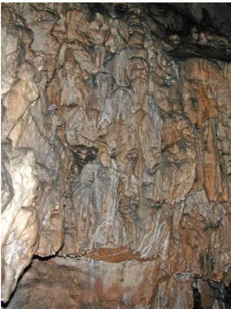
Reich gegliederter Vorhang aus Kalksinter in der Schertelshöhle bei Westerheim

Seit 2016 gehört die Schertelshöhle zu den Geopoints des Geoparks Schwäbische Alb. Die Besucherhöhle ist außerdem Teil des Netzwerks „Informationszentren im Biosphärengebiet Schwäbische Alb“ und eine von 15 Anlaufstellen der „Partner des Biosphärengebiets“. Nur je etwa 200 m entfernt liegt auf der anderen Talseite das Steinerner Haus und nördlich davon die Ruine der Burkhardtshöhle.