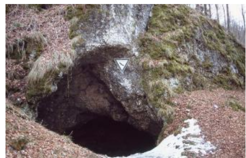
Das Steinerner Haus auf der Mittleren Kuppenalb bei Westerheim

Seit 2016 gehört die Schertelshöhle zu den Geopoints des Geoparks Schwäbische Alb. Die Besucherhöhle ist außerdem Teil des Netzwerks „Informationszentren im Biosphärengebiet Schwäbische Alb“ und eine von 15 Anlaufstellen der „Partner des Biosphärengebiets“. Nur je etwa 200 m entfernt liegt auf der anderen Talseite das Steinerner Haus und nördlich davon die Ruine der Burkhardtshöhle.