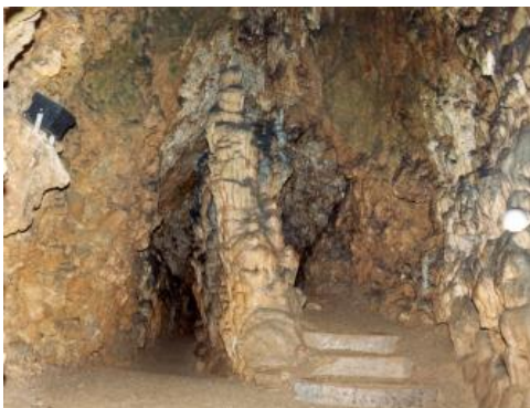
In der Schertelshöhle bei Westerheim

Die Schertelshöhle befindet sich auf der Schwäbischen Alb, im vorspringenden rechten Talhang eines Trockentals, das zum Filstal führt, ca. 3,5 km nordwestlich von Westerheim. Sie ist in Kalksteinen des Oberjuras als Flusshöhle entstanden, weist einen L-förmigen Verlauf auf und wird im Knick durch einen künstlichen Eingangsstollen betreten. Die Gesamtlänge beträgt ca. 212 m, geführt wird der Besucher durch 160 m. Die Höhle ist sehr reich an Klüften, malerischen Tropfsteinen und Sinterfahnen. Im tiefsten Teil der Höhle trifft man auf eine bis 15 m hohe Halle mit viel Sinterschmuck (Binder & Jantschke, 2003).