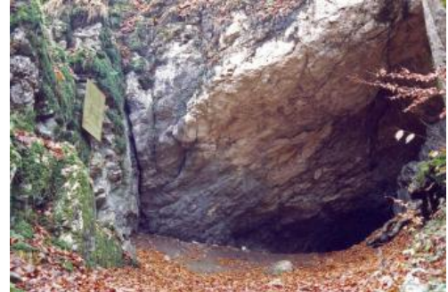
Die Bärenhöhle am Talausgang des Wolfstals bei Lauterach