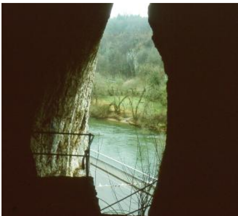
Die Geisterhöhle bei Rechtenstein (Alb-Donau-Kreis)

Wenige Kilometer donauabwärts öffnet sich bei Rechtenstein, unterhalb des Rechtensteiner Felsens, direkt an der Donaubrücke, die Geisterhöhle (Rechtensteiner Höhle) . Es handelt sich um eine Spaltenhöhle im Oberen Massenkalk des Oberjuras (früher Weißjura zeta) mit vier parallel verlaufenden Gängen bis 20 m Länge. Ausgrabungen ergaben Funde aus der Römerzeit, in tieferen Fundlagen auch Knochen von Rentier und Höhlenbär. Der Schlüssel zum normalerweise verschlossenen Zugang ist im Wirtshaus „Zur Brücke“ erhältlich.