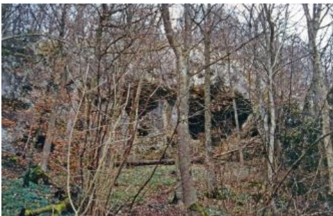
Die Bettelmanshöhle im Tal der großen Lauter südöstlich der Burgruine Derneck

Im weiteren Verlauf des Großen Lautertals finden sich talaufwärts viele kleinere Höhlen, Überhänge oder Felsnischen. Etwa 300 m südöstlich von Burg Derneck (Hayingen-Münzdorf) öffnet sich beispielsweise oberhalb eines kurzen Steilhangs östlich der Straße durch das Große Lautertal der 6 m breite und 5 m hohe Zugang zur Bettelmanshöhle . Die 57 m lange, ansteigende Höhle (Backofentyp) im Unteren Massenkalk des Oberjuras besitzt eine 8 m breite und 2–3 m hohe Halle. Aus der Höhle werden Funde aus der Jungsteinzeit, Latènezeit und aus dem Mittelalter erwähnt. In dem von Nordwesten ins Lautertal einmündenden Tieftal, dem steilen Ausläufer des als breites Trockental die Albhochfläche durchziehenden Ehestetter Tals, öffnet sich ca. 800 m nordöstlich von Münzdorf unter einem Felsüberhang im Unteren Massenkalk der Eingang zu der 43 m langen Ghaiwaldhöhle.