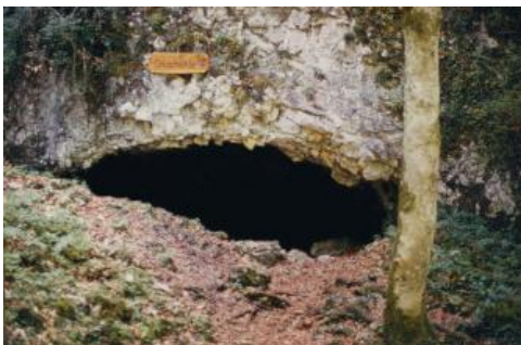
Eingang der Glashöhle westlich von Hayingen

Auf der Schwäbischen Alb bei Hayingen und Zwiefalten sind neben der bekannten Besucherhöhle bei Hayingen-Wimsen (Friedrichshöhle) noch weitere kleinere Höhlen zu entdecken.