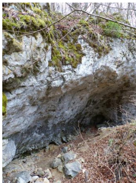
Die Schunterhöhle am Südwest-Hang des Rautals 1100 m nordöstlich von Ehingen-Briel