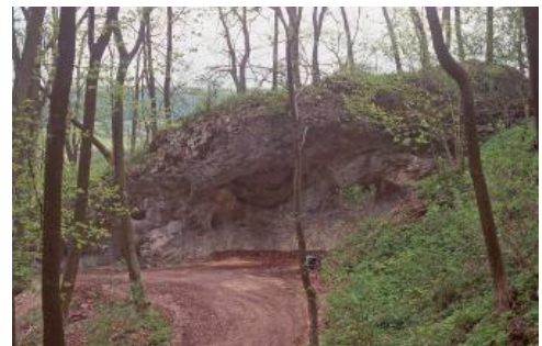
Felsställe zwischen EHINGEN a. d. D. und Kirchen

Auf der Schwäbischen Alb zwischen EHINGEN an der Donau und Kirchen liegt östlich der Straße Schlechtenfeld – Mühlen, ca. 500 m südöstlich der Ortsmitte von Mühlen, die Nischenhöhle (Abri) des Felsställe. Diese halbkreisförmig nach Süden geöffnete Höhle ist bis 10 m breit und 4 m hoch und entstand durch Auswaschung im Oberen Massenkalk. Ausgrabungen der Kulturschichten durch das Landesdenkmalamt von 1975–80 erbrachten eine Fülle von Artefakten (Schmuck, Werkzeuge) und Tierknochen aus dem Übergang zwischen Altsteinzeit und Mittlerer Steinzeit (Magdalénien bis Beuronien). Dabei wurde auch ein Kalkstein mit einem in roter Farbe gezeichneten Rinderkopf entdeckt. Die hohe Zahl von allein über 400 000 Funden aus dem Magdalénien lässt auf eine häufige und längerfristige Verwendung als Wohnplatz in dieser Zeit schließen. In der Jungsteinzeit wurde der Ort nochmals für eine Bestattung genutzt.