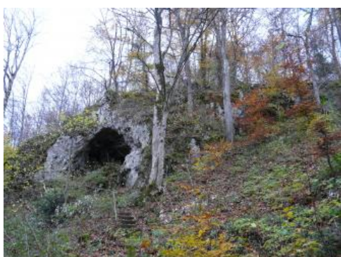
Die Höhle Kätherenküche am Nordhang des Brieltals östlich von Ehingen-Briel

Nur etwa 500 m südsüdwestlich der Schunterhöhle liegt auf der Südseite des Brieltals die Höhle Kätherenküche. Sie entwickelte sich ebenfalls im Oberen Massenkalk. Die Kätherenküche ist über 7 m lang sowie am Eingang 3,8 m hoch und 4,8 m breit. In der Höhle soll in der Zeit um 1800 die Tochter Katharina der Familie Schonter gehaust haben. Östlich und südwestlich der Höhle gibt es bis zu 7 m hohe Felsen.