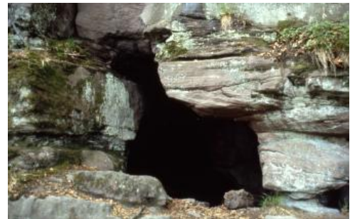
Bruderhöhle nördlich von Hirsau

Die Bruderhöhle erreicht man nördlich des Klosters Hirsau bei Calw, am Osthang des Nagoldtals. Sie stellt eine Verwitterungsbildung des anstehenden Buntsandsteins (Vogesensandstein-Formation) dar. Die unterschiedliche Härte der Sandsteine hat zu einer Wabenverwitterung geführt. An den Wänden der rund 12 m langen Höhle sind zahlreiche Sedimentstrukturen aufgeschlossen.