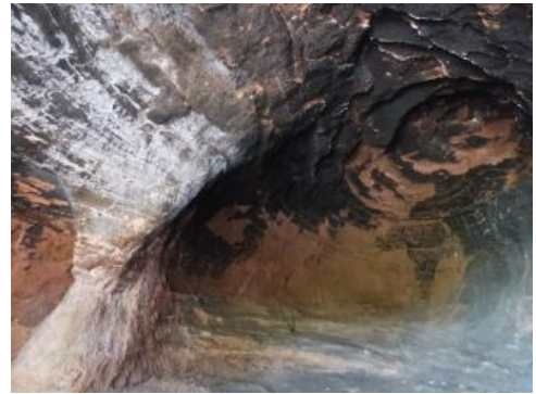
Moosmannshöhle bei Lauterbach