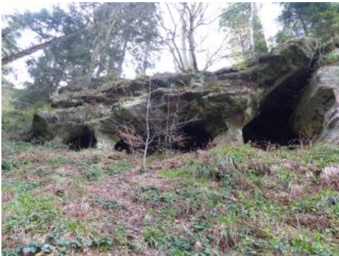
Teufelskammern beim Großen Loch ost-südöstlich von Loffenau

Bei den Teufelskammern unweit vom Großen Loch östlich von Loffenau im Nordschwarzwald handelt es sich um höhlenartige Erosionsformen in der Eck-Formation des Unteren Buntsandsteins. Sie entstanden durch Absanden weicherer Sandsteine unter einer härteren, verkieselten Buntsandsteinschicht, welche die Decke der Teufelskammern bildet. Dieses Dach ruht auf zwei dicken Sandsteinfeilern, die bisher der Erosion trotzen konnten und die bis 4 m tiefen Höhlungen vor dem Zusammenbrechen bewahrten. Diese Höhle soll im 19. Jahrhundert Wilderern und Schmugglern Zuflucht gewährt haben, die an der nahe gelegenen ehemaligen Grenze zwischen dem Königreich Württemberg und dem Großherzogtum Baden tätig waren.