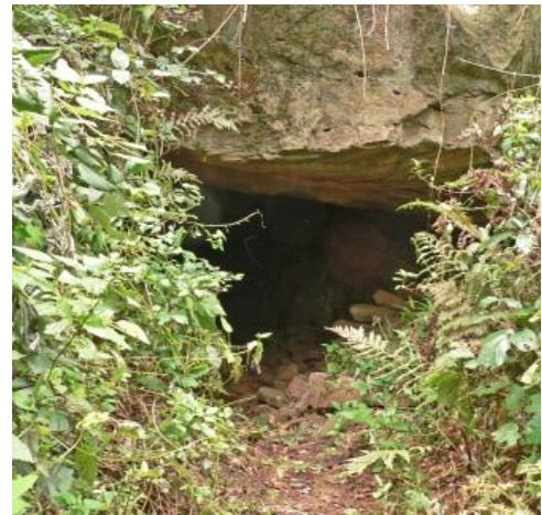
Das Meutersloch bei Heidelberg-Ziegelhausen

Das Meutersloch liegt im Odenwald, am nördlichen Talhang des Neckars, westlich oberhalb der ehemaligen Schokoladenfabrik in Heidelberg-Ziegelhausen und stellt eine natürliche Höhle im Unteren Buntsandstein (Miltenberg-Formation) dar. Die Höhle weist eine Länge von ca. 10 m, eine Breite von ca. 4 m und eine Höhe von ca. 1,5 m auf. Am Höhleneingang und an den Wänden sind unterschiedliche Schichtungsstrukturen erkennbar. Als Besonderheit fallen an der Höhlendecke Netzleisten auf. Dabei handelt es sich um Trockenrisse einer zur Buntsandsteinzeit trocken gefallenen Landoberfläche, die von feinerem Material überschüttet, ausgefüllt und verfestigt wurden.