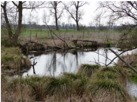
Quelltopf Grimmensee östlich von Langenau

Im Donautal nordöstlich von Ulm liegt der Grimmensee. Der Karstquelltopf befindet sich am Rand eines Wäldchens ca. 3500 m östlich von Langenau, westlich der See- und Ölmühle. Von einer Schülergruppe des Robert-Bosch-Gymnasiums Langenau unter der fachlichen Leitung von G. Krämer wurde hier ein kurzer Lehrpfad ausgearbeitet. Auf vier Informationstafeln werden geologische und hydrologische Zusammenhänge erklärt und Verkarstung, Karstformen und bodenkundliche sowie geologische Profile zum Thema gemacht.