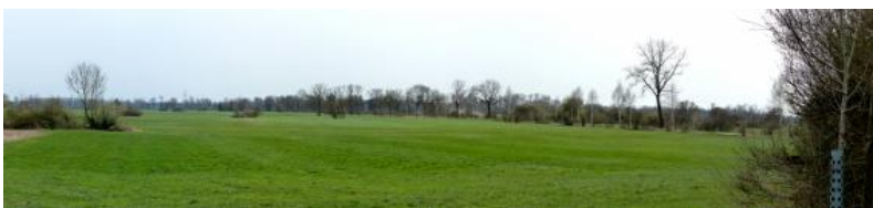
Im Langenauer Ried

bis in die Gegend von Langenau, wo es in Karstaufbrüchen und Quelltöpfen wie dem Grimmensee oder der Nauquelle wieder austritt. Die Oberjura-Gesteine sind auf der Flächenalb zwischen dem Lonetal und Langenau teilweise von gering durchlässiger, tertiärer Molasse und quartärem Lösslehm überdeckt, wodurch das Grundwasser besser vor Verunreinigungen geschützt ist. Der Zufluss des Karstwassers in das Donautal hat zu einer großflächigen Moorbildung beigetragen. Die Niedermoorortfe des Langenauer Rieds sind häufig mit Lagen aus Wiesenkalk durchsetzt, der aus dem karbonatreichen Wasser von der Schwäbischen Alb ausgefallen ist.