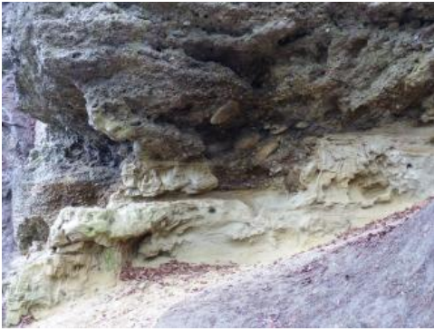
Tiefere Hochrhein-Deckenschotter über Oberer Süßwassermolasse östlich von Überlingen-Haldenhof (Bodenseekreis)

Mit der Auffaltung der Alpen im Tertiär bildete sich an der Nordseite des entstehenden Gebirges ein langgestrecktes Becken, das etwa vom Genfer See über den süddeutschen Raum bis nach Österreich reichte. In diesen Molasse-Trog wurde der Abtragungsschutt der randlich anschließenden Festländer und vor allem der aufsteigenden Alpen eingetragen. Dabei kam es zwei Mal zu Meeresvorstößen (Untere und Obere Meeresmolasse). Dazwischen waren Fluss- und Seelandschaften entwickelt (Untere und Obere Süßwassermolasse). Jeweils beim Rückzug des Meeres gab es gut erkennbare Übergänge zwischen Salz- und Süßwassereinfluss (Brackwassermolasse). Die Geologie der tertiären Molasseablagerungen und die Wirkungen der quartären Eiszeit im Rheingletschergebiet wird im Verlauf des Lehrpfades auf mehreren Stationen sowie in einer Broschüre anschaulich erklärt. Gute Einblicke in den Gesteinsaufbau finden sich vor allem in der Umgebung des Haldenhofs. Hier können die Obere