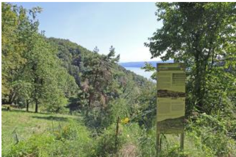
Station Landschaftsentstehung am Geologischen Lehrpfad Sipplingen

Der Geologische Lehrpfad in Sipplingen beschäftigt sich mit der Erdgeschichte der letzten 22 Millionen Jahre und der Landschaftsentwicklung am steilen, nördlichen Ufer des Überlinger Sees. Der annähernd 5 km lange Lehrpfad kann entweder von der Burkhard-von-Hohenfels-Straße am nordwestlichen Ortsende von Sipplingen oder vom Haldenhof aus erwandert werden. Am Bahnhof in Sipplingen und am Wanderparkplatz an der Seestraße findet man Tafeln zum Wegverlauf.