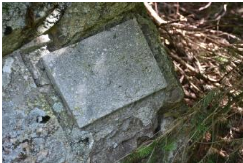
Ganggestein an Station 8 am Pfad ins Erdaltertum bei Tunau

Die Umgebung der kleinen Gemeinde Tunau bei Schönau im südlichen Schwarzwald liegt im Bereich einer geologischen Nahtstelle, der sog. Badenweiler–Lenzkirch-Zone. Es handelt sich um einen 2–5 km schmalen, quer durch den Südschwarzwald verlaufenden Streifen, in dem an einer alten Plattengrenze schwach umgewandelte Sedimentgesteine und Vulkanite aus dem Erdaltertum (Unterkarbon) vorkommen (Sawatzki & Hann, 2003). Der Pfad ins Erdaltertum erklärt an mehreren Stationen die Gesteine, die bei der damaligen Kollision zweier Kontinentalplatten entstanden sind. Die Felsblöcke sind auf einer kleinen Fläche angeschliffen, so dass die Mineralkörner gut zu erkennen sind. Die einzelnen Stationen sind allerdings nur durch Nummern gekennzeichnet. Eine ausführliche Broschüre dazu ist bei der Touristeninformation in Schönau oder bei schwarzwaldregion-belchen.de/de/prospekte erhältlich. Sie enthält anschauliche Grafiken und Fotos und gibt zudem auch Auskunft über die erdgeschichtliche Entwicklung der umgebenden Landschaft, die man von mehreren Aussichtspunkten gut überblicken kann (Lehnes & Tochtermann, 2001).