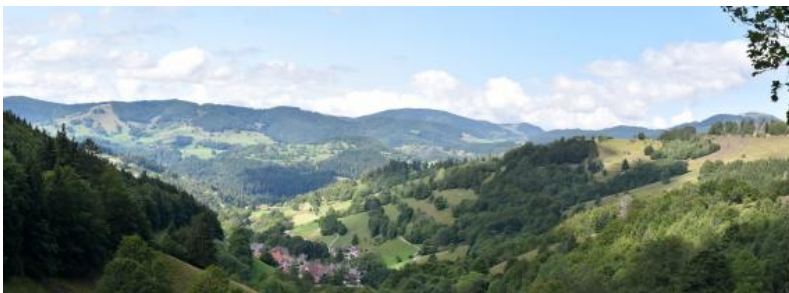
Panoramablick über Tunau nach Westen ins Wiesetal bei Schönau und ganz rechts nach Nordwesten zum Belchen

Die Umgebung der kleinen Gemeinde Tunau bei Schönau im südlichen Schwarzwald liegt im Bereich einer geologischen Nahtstelle, der sog. Badenweiler–Lenzkirch-Zone. Es handelt sich um einen 2–5 km schmalen, quer durch den Südschwarzwald verlaufenden Streifen, in dem an einer alten Plattengrenze schwach umgewandelte Sedimentgesteine und Vulkanite aus dem Erdaltertum (Unterkarbon) vorkommen (Sawatzki & Hann, 2003). Der Pfad ins Erdaltertum erklärt an mehreren Stationen die Gesteine, die bei der damaligen Kollision zweier Kontinentalplatten entstanden sind. Die Felsblöcke sind auf einer kleinen Fläche angeschliffen, so dass die Mineralkörner gut zu erkennen sind. Die einzelnen Stationen sind allerdings nur durch Nummern gekennzeichnet. Eine ausführliche Broschüre dazu ist bei der Touristeninformation in Schönau oder bei schwarzwaldregion-belchen.de/de/prospekte erhältlich. Sie enthält anschauliche Grafiken und Fotos und gibt zudem auch Auskunft über die erdgeschichtliche Entwicklung der umgebenden Landschaft, die man von mehreren Aussichtspunkten gut überblicken kann (Lehnes & Tochtermann, 2001).