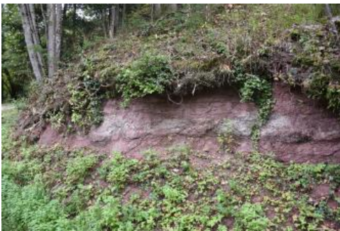
Zu Beginn des Geologischen Pfads sind am Unterhang die Rotliegend-Sedimente aufgeschlossen.

Direkt oberhalb des Stadtzentrums von Schramberg, am Ostrand des Mittleren Schwarzwalds, erhebt sich der Schlossberg mit der Ruine Hohenschramberg. Hier wurde bereits 1972 ein Naturlehrpfad angelegt, der die Geologie und die Pflanzenwelt des Schlossbergs erschloss. Im Jahr 1996 wurde der inzwischen in die Jahre gekommene Lehrpfad völlig überarbeitet. Er teilt sich jetzt in einen Aufstieg zur Ruine, der überwiegend geologischen Themen gewidmet ist und einen absteigenden Weg, der als vegetationskundlicher Pfad gestaltet wurde.