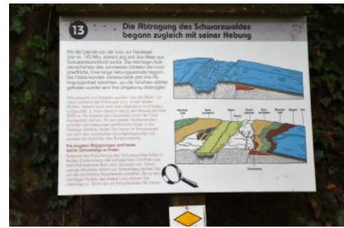
Erklärungen zur Entstehung des Schwarzwalds am Geologischen Pfad bei Schramberg

Entlang des Pfades passiert man die einen hohen Versatz aufweisende Schramberger Hauptverwerfung. Die Folge ist ein eindrucksvoller Wechsel verschiedener Gesteine auf engstem Raum. Am Hangfuß stehen zunächst die Rotliegend-Sedimente an (Schramberg-Formation). Sie sind im Unteren Perm vor 272–296 Mio. Jahren entstanden und besitzen bei Schramberg eine außergewöhnlich hohe Mächtigkeit. Es handelt sich überwiegend um rotbraune, schlecht sortierte Arkosebrekzien und -konglomerate (Fanglomerate), die als Schuttfächer-Sedimente abgelagert wurden. Sie sind der Abtragungsschutt des Variskischen Gebirges, das im Erdaltertum existierte, lange bevor der Schwarzwald entstand. Im weiteren Verlauf des Weges überschreitet man die Verwerfung und sieht plötzlich Felsen und Aufschlüsse im Triberg-Granit, der als Tiefengestein bei der damaligen Gebirgsbildung entstand. Beim folgenden Anstieg wendet der Weg wieder nach Osten und quert die Verwerfung ein weiteres Mal, so dass man jetzt Aufschlüsse in Gesteinen des Deckgebirges antrifft, die nach der Abtragung des Variskischen Gebirges abgelagert wurden. Es handelt sich am Schlossberg v. a. um Sandsteine der Kirnbach- und Tigersandstein-Formation (Zechstein) sowie der Eck-Formation (Unterer Buntsandstein). Den Gipfelbereich mit der Ruine bilden harte, geröllführende Sandsteine der Geröllsandstein-Subformation (Mittlerer Buntsandstein).