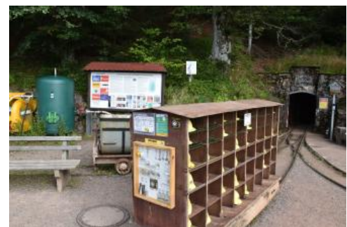
Eingangsbereich beim Museums-Bergwerk Schauinsland

Der in 1000 bis über 1200 m Höhe im Südschwarzwald bei Freiburg gelegene Erzkasten-Rundweg führt auf 5 km Länge rund um den Gipfelbereich des Schauinslands und seine Südhängen. Er informiert anhand von 18 Schautafeln über ein breites Spektrum an Themen. Neben Landschaft, Besiedlung, Landwirtschaft, Wald, Natur- und Biotopschutz spielen auch Geologie und Bergbau eine wichtige Rolle. Bereits seit dem Mittelalter ist für den Schauinsland ein umfangreicher Silberbergbau belegt, deshalb auch der Name Erzkasten. Später baute man auch Blei- und Zinkerz ab. Das Museumsbergwerk Schauinsland ist die wichtigste Station des Lehrpfades. Südlich des Bergwerks ist der alte, 1988 neu aufgewältigte Stollen Gegentrum VIII sowie eine größere vegetationsfreie Halde zu sehen. Auf der Südostseite des Berges bekommt man einen Überblick über die während der Eiszeit gestalteten Geländeformen. Außerdem werden charakteristische Gesteine des Schauinslandgebiets gezeigt.