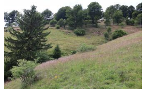
Weideland am Südhang des Schauinslands

Die Kulturlandschaft am Schauinsland ist außerhalb des Waldes durch eine extensive Weidewirtschaft geprägt und steht auf 1054 ha unter Naturschutz. Ihr Kennzeichen sind die zahlreichen, oft vielstämmigen Weidbuchen. Sie stehen inmitten von Borstgrasrasen, Flügelginsterweiden und Zwergstrauchheiden oder bilden Buchenhaine. Die Flächen wurden früher u. a. vom Schniederlihof bewirtschaftet. Der denkmalgeschützte Hof von 1593 ist eines der am besten erhaltenen Exemplare vom Typ der Schauinslandhäuser. Er wird heute als Bauernhausmuseum und Gastwirtschaft genutzt.