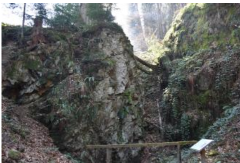
Rest eines ehem. Abbau-Schachts am bergbauhistorischen Lehrpfad Birkenberg bei Bollschweil-St. Ulrich

Der Birkenberg westlich von Bollschweil-St.Ulrich im Südschwarzwald ist ein mittelalterliches Bergbaugesbiet, in dem vom 11. bis 14. Jh. Silber, Kupfer und Blei abgebaut wurde. Die am Talhang der Möhlin anstehenden Gneise werden von dünnen steilstehenden Quarzgängen durchzogen. Die enthaltenen Erze hatten im Mittel einen Silbergehalt von 1 %, was im Vergleich zu anderen Revieren im Schwarzwald damals außergewöhnlich viel war. Vermutlich deshalb, und wegen der guten Zugänglichkeit vom Rheintal her, wurde in dem Gebiet eine kleine Schutzburg, die Birchiburg, errichtet. Bereits 1377 wurde die Burg wieder zerstört. Um 1400 hatte man auf dem Gelände ein neues Wohngebäude errichtet, der Abbau wurde aber bald darauf aufgegeben. Vermutlich hatten die Schächte den Grundwasserspiegel erreicht, wodurch der Weiterbetrieb unrentabel wurde (Werner, 2019b).