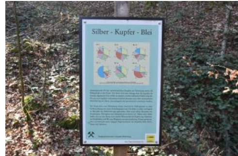
Schautafel zur Elementverteilung in Erzproben vom Birkenberg bei Bollschweil-St. Ulrich – bergbauhistorischer Lehrpfad

Der Nordhang des Birkenbergs wurde ab dem Jahr 1987 intensiv archäologisch erforscht. Seitdem steht das Gelände als montanhistorisches Kulturdenkmal von herausragender Bedeutung unter Denkmalschutz. Das Institut für Ur- und Frühgeschichte der Universität Freiburg hat umfangreiche Untersuchungen über und unter Tage vorgenommen und wichtige Erkenntnisse über die Birchiburg und den damaligen Bergbau gewonnen (Fröhlich, 2013). Es zeigte sich, dass die mittelalterliche Infrastruktur im Gelände in einzigartiger Weise erhalten ist, da nach der Blütezeit des Abbaus kein neuzeitlicher Bergbau mehr erfolgte. Um dieses bergbauhistorische Gebiet und seine mittelalterlichen Bergwerksanlagen dem interessierten Bürger zugänglich zu machen, wurde im Auftrag der Gemeinden Bollschweil und Bad Krozingen 2004 auf einer Wegstrecke von 1,6 km ein bergbauhistorischer Lehrpfad durch das steile, aber gut erschlossene Waldgelände angelegt. Auf 23 Infotafeln wird viel Wissenswertes über die zerstörte Burg, über Stollen, Pingen, Halden, Bergschmieden, aber auch über Arbeits- und Wohnanlagen der früheren Bergleute vermittelt.