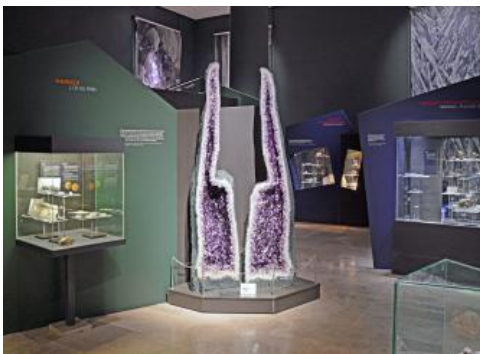
Große Amethyst-Druse in der Mineralienabteilung des Staatlichen Museums für Naturkunde Karlsruhe

Das Staatliche Museum für Naturkunde präsentiert in der geowissenschaftlichen Abteilung regionale Geologie am Oberrhein von der Entstehung der Erde bis zur heutigen geologischen Forschung. Im Zentrum steht dabei ein interaktives Landschaftsmodell. Im Mineraliensaal sind farbenprächtige Minerale und Erze aus Schwarzwald und Kaiserstuhl zu bewundern. In der paläontologischen Abteilung wird die Entwicklung des Lebens seit dem Kambrium vor 540 Millionen Jahren dargestellt. Objekte der südbadischen Fossilfundstellen Öhningen und Höwenegg bilden einen weiteren Schwerpunkt. Im zentralen Lichthof beeindruckt eine mehrere Meter hohe Wand mit versteinerten Meereslebewesen aus dem Unterjura vor etwa 180 Mio. Jahren. Ein großes Vivarium steht unter dem Thema „Form und Funktion – Vorbild Natur“. Der modern gestaltete Ausstellungsbereich „Klima und Lebensräume“, eine umfangreiche