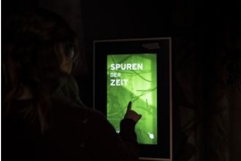
In der interaktiven Ausstellung im Nationalparkzentrum Schwarzwald

Mit der neuen, interaktiven Ausstellung zum wilder werdenden Wald, einem Kino, der Brücke der Wildnis, einem Shop und einem Café ist das neue Nationalparkzentrum ein spannendes Tagesziel inmitten der wunderschönen Natur des Nordschwarzwalds – auch bei schlechtem Wetter. Der Ort ist auch der ideale Startpunkt für eine erste Erkundung des Nationalparks. Die Mitarbeiterinnen und Mitarbeiter stehen dort für alle Fragen zum Schutzgebiet und für Tourentipps gerne zur Verfügung. Am Ruhestein haben zudem viele Veranstaltungen und Führungen ihren Ausgangspunkt, an denen man nach vorheriger Online-Anmeldung teilnehmen kann.