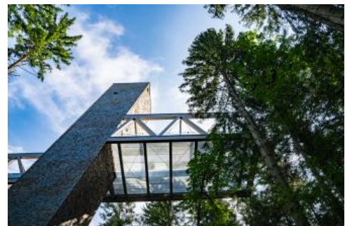
Aussichtsturm im Nationalparkzentrum Schwarzwald

Der in 900 m Höhe liegende moderne Bau fügt sich so harmonisch in den umgebenden Wald ein, als hätte er schon immer hier gestanden. Mit den langen, übereinander liegenden Riegeln, die an bei einem Sturm umgeworfene Baumstämme erinnern, bringt das Nationalparkzentrum Ruhestein auch sein Inneres schon nach Außen. Vom 34 m hohen Aussichtsturm können die Gäste den Ausblick in den an dieser Stelle etwa 120 Jahre alten Tannen- und Fichtenwald genießen.