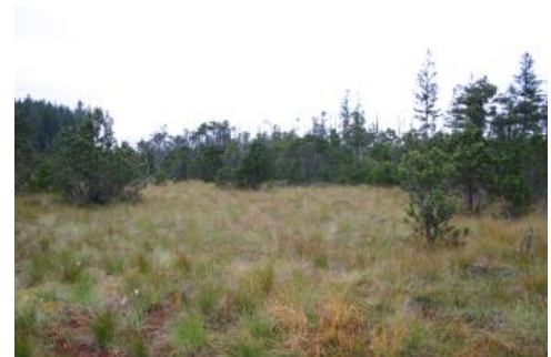
Das Gründlenried liegt in einem Zungenbecken nördlich von Kißlegg und wird über die Wolfegger Ach zum Bodensee hin entwässert.

Das Gründlenried befindet sich etwa 4 km nördlich von Kißlegg im Westallgäuer Hügelland. Es bildet zusammen mit dem östlich anschließenden Rötseemoos eine größere Moorlandschaft, die auf 347 ha unter Naturschutz steht. Durch das Gebiet verläuft die Wasserscheide zwischen der zum Rhein hin entwässernden Wolfegger Ach und dem zum Flussgebiet der Donau gehörenden Rotbach. Das Zentrum wird von einem ausgedehnten Hochmoor eingenommen. Hier wurden bis über 6 m mächtige Torfe erbohrt. Zwei trichterförmige Schlucklöcher im Zentralbereich sind mit einem Quellgebiet und Quelltopf am südlichen Rand des Hochmoorschildes in einem unterirdischen Abflusssystem verbunden. Außerdem sind einige kleine Moorseen (Kolke) ausgebildet. Kleinere Hochmoorbereiche finden sich im Brenntelesmoos und östlich von Rötsee. Im Rötseemoos fand starker Torfabbau statt, die übrigen Hochmoore blieben bis auf Randbereiche weitgehend verschont. Die Niedermoore sind durch Entwässerung und Düngung in ihrem ökologischen Wert meist stark beeinträchtigt.